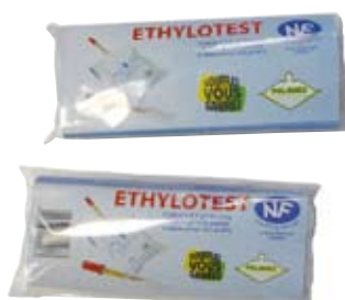
Emplacement pour 2 Ethylotests Etui livré vide

Dimension ouverte : 17 x 10 cm Dimension fermé : 12 x 10 cm