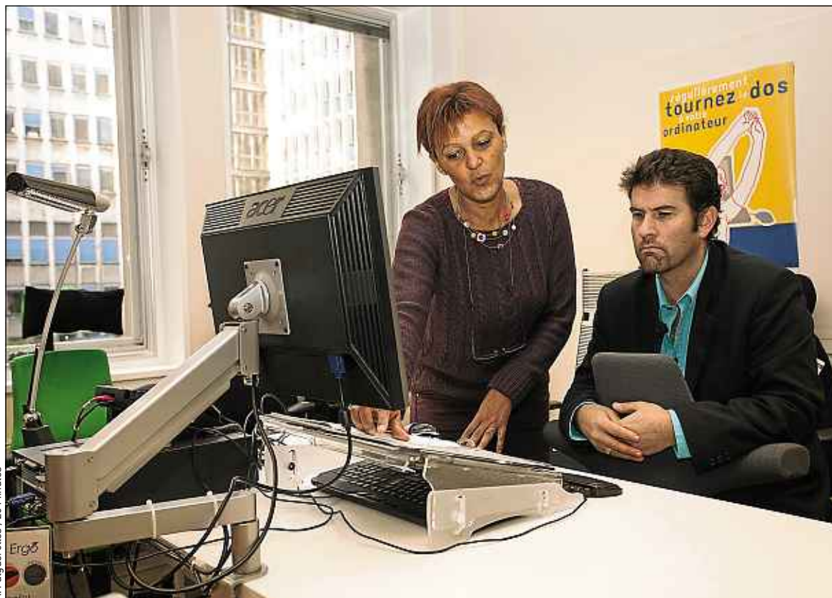
Un fauteuil ergonomique (ici le Capisco, qui s'utilise en ventral) ou un pupitre peuvent faciliter la vie au travail.

Les psychomotriciens, eux, n'ont pas vocation à intervenir dans le milieu professionnel, mais leur travail de rééducation de troubles tels que les tics nerveux, l'agitation ou les problèmes de concentration permettent une meilleure insertion dans l'environnement professionnel. ■ V. T.