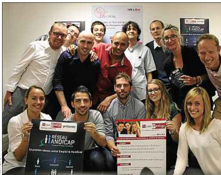
L'équipe de JobinLive a commencé l'aventure Réseaux-Handicap cette année.