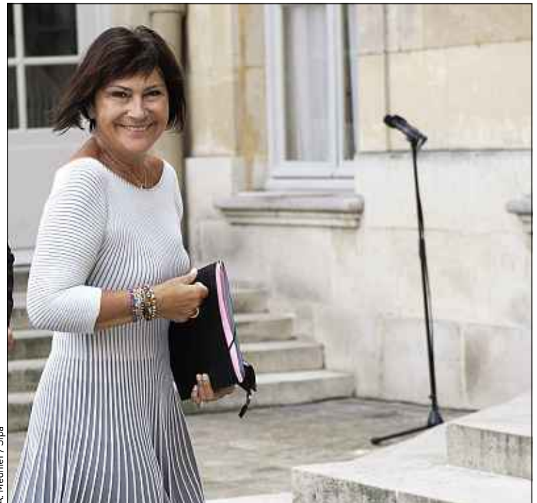
A. Meunier / Sipa

Des mesures relatives à l'obligation de reconversion dans l'entreprise après une déclaration d'inaptitude, mais aussi le renforcement de l'alternance, ont été annoncées. Le calendrier de réalisation sera étalé dans le temps. Certaines mesures nécessitent de revoir des textes, d'autres être négociées par les partenaires sociaux. Par exemple, le volet sur l'alternance fera partie de la réforme de la formation professionnelle en cours.