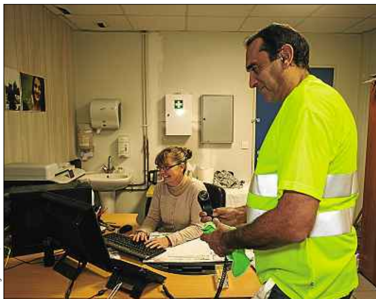
A. Faiguerolles / 20 Minutes

Entourés de collègues valides et chapeautés par un accompagnateur au sein de leur entreprise adaptée, les collaborateurs handicapés pourront ainsi s'acclimater progressivement au monde du travail. Et pourquoi pas, à terme, décrocher un job dans une société classique. C'est le cas d'Abel**. Souffrant d'une malformation de naissance au