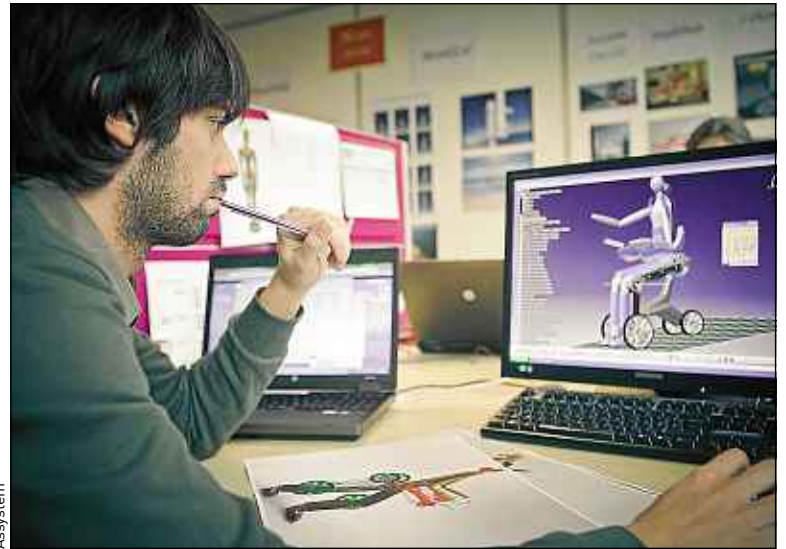
Le fauteuil, pour l'instant au stade du prototype, est prévu pour 2016.