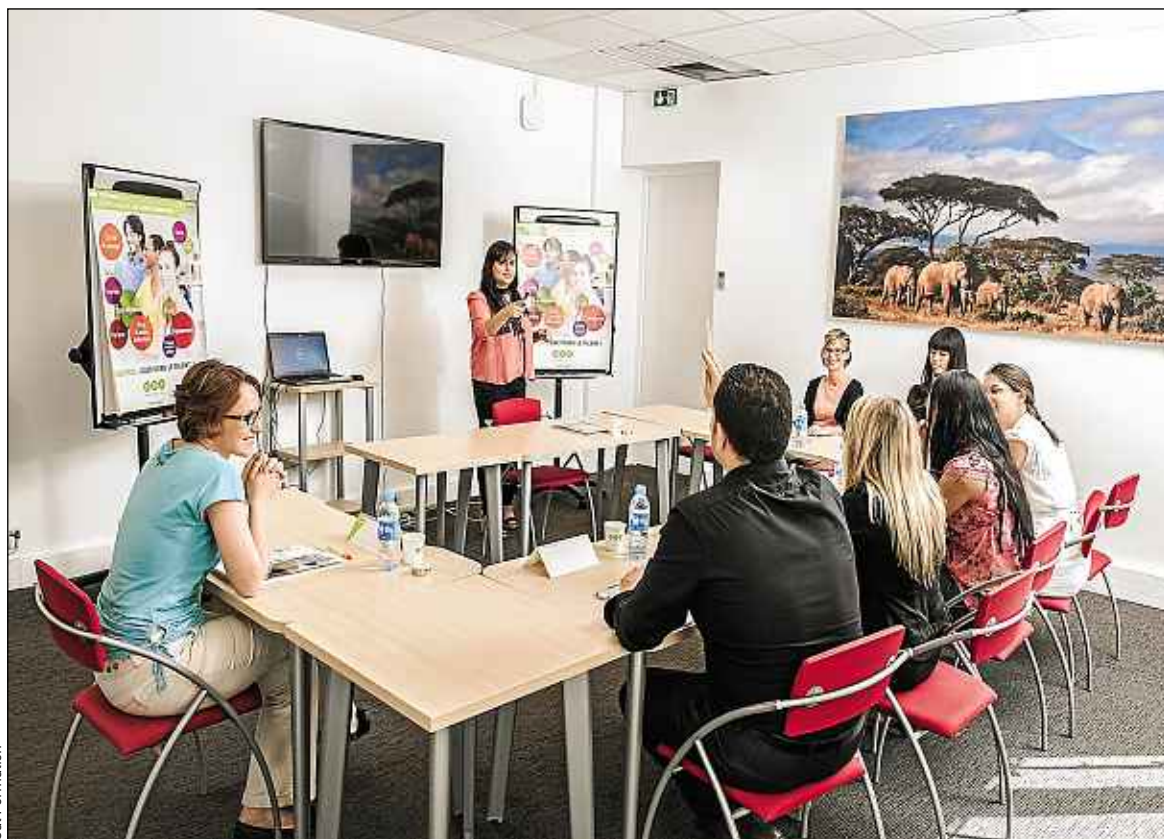
Une réunion organisée par Cal Formation pour impliquer les salariés dans l'insertion du handicap en entreprise.

« Il s'agit de prendre le temps nécessaire pour se mettre d'accord sur les aménagements correspondants aux besoins. Quels équipements et quelle organisation pour un collaborateur atteint d'une maladie invalidante par exemple ? La réponse n'est pas évidente. De plus, en voulant bien faire, le manager risque de préjuger des besoins et de prendre des mesures finalement inadaptées », ajoute Valérie Tran. De même, la PH doit fixer les règles du jeu vis-à-vis de son handicap. Si elle le souhaite, elle demandera l'aide de ses collègues, sans exiger une anticipation systématique de ses besoins. ■ S. L.