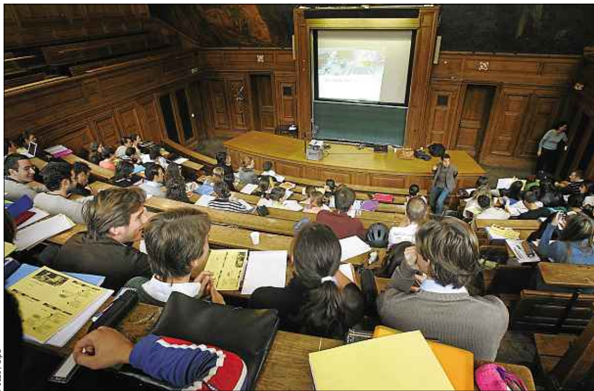
77 % des personnes handicapées n'ont qu'un niveau bac. L'alternance est faite pour les pousser à aller au-delà.

Depuis 2011, le site handi-alternance.fr tente de répondre à cette problématique, suivi plus tard de l'organisation des Mardis du handicap, journées de recrutement organisées sur l'année dans les principales villes de France. A leur issue, 30 % des candidats y trouvent un travail. « L'alternance était déjà utilisée, rap-