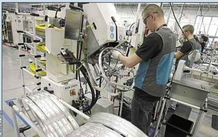
Ces contrats concernent les jeunes peu diplômés, handicapés ou non.

Côté employeurs, l'Etat finance une partie de ces contrats et l'Agefiph (Association chargée de gérer le fonds pour l'insertion professionnelle des personnes handicapées), l'organisme collecteur des contributions des entreprises assujetties à l'obligation d'emploi de travailleurs handicapés, leur accorde une aide supplémentaire (plafond de 10 300 euros). Fin août, 1 080 aides avaient été octroyées. ■ S. L.