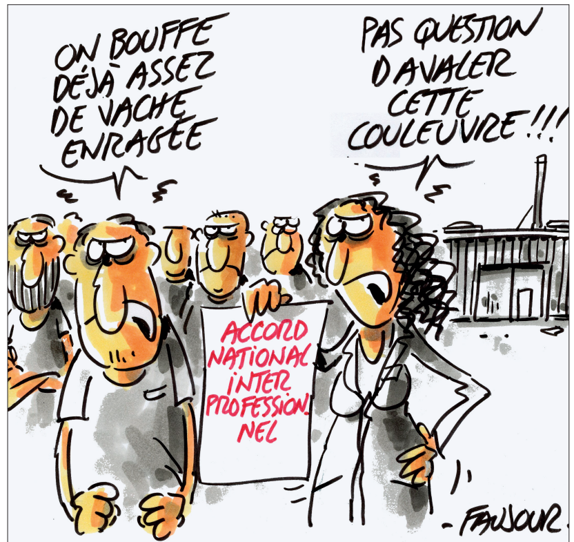
Bernard Thibault, secrétaire général de la CGT

Le 11 janvier 2013, les négociations nationales dites de «sécurisation de l'emploi» se sont terminées par un accord d'une extrême gravité pour les droits des salariés. La CGT et FO ont annoncé qu'elles ne le signeront pas. Par contre, la CFTD, la CGC et la CFTC ont décidé de le parapher. Un projet de loi doit être présenté au Conseil des ministres début mars, pour ensuite être voté au Parlement en mai.