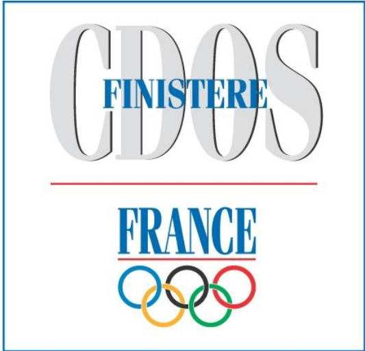
COMITE DEPARTEMENTAL OLYMPIQUE ET SPORTIF