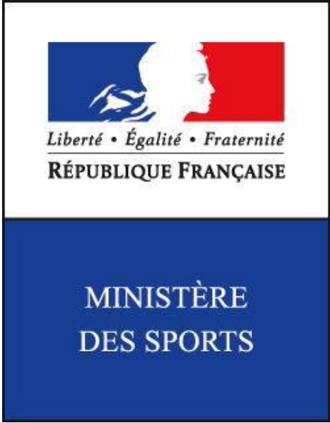
Direction Départementale de la Cohésion Sociale