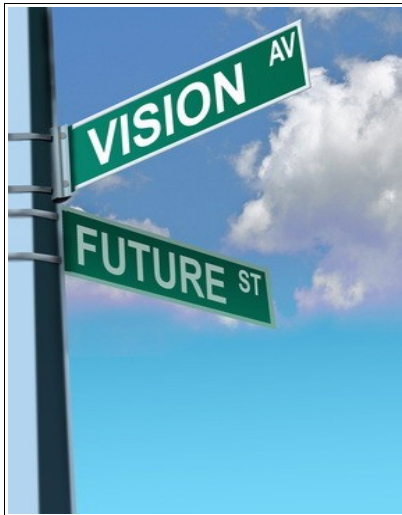
Les chanceux croient en un avenir positif

Une personne chanceuse est persuadée que demain sera fait de choses positives, elle croit dans le futur comme la période la plus propice pour voir se réaliser ses souhaits. Elle est constamment dans l'attente d'événements heureux, c'est cela la vraie pensée positive. Ces personnes chanceuses sont particulièrement persévérantes, comme elles sont optimistes sur leurs chances de réussite, elles n'abandonnent jamais et ne renoncent pas lorsque survient un