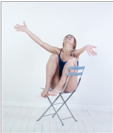
En chaque événement négatif, il y a toujours une part de positif

Les chanceux ne se laissent pas abattre par un retour de fortune ou un échec mais ils y voient une opportunité ou un apprentissage. Ils transforment littéralement la malchance en chance avec ce processus. On peut dire qu'ils disposent d'un arsenal de techniques mentales qui leur permettent de mieux s'en sortir et de s'adapter aux situations.