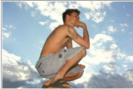
Les chanceux ont un esprit prêt à accueillir la chance

Les gens chanceux parviennent à en tirer systématiquement profit car ils y croient de façon positive, ils affichent une confiance en soi, ne tournent pas le dos aux nouvelles expériences et ne passent pas leur temps à se dire « Je suis trop vieux », « Je n’y arriverai pas » ou « C’est trop