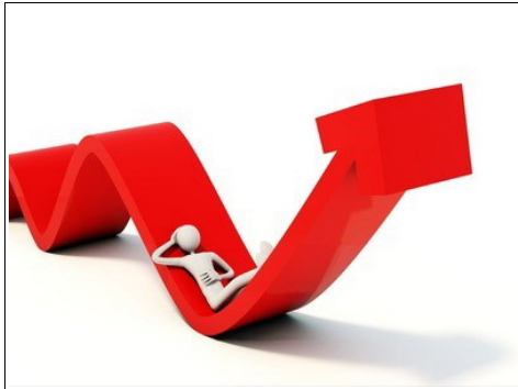
La relaxation nous permet d'écouter nos pressentiments subconscients.

Les personnes qui ont de la chance prennent plus souvent les bonnes décisions que les autres car elles accordent de l'attention à leur intuition. Ne vous êtes-vous jamais dit lorsque vous vous étiez trompé: «...ma première intuition était la bonne»?