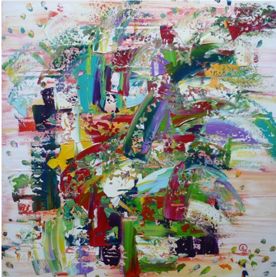
Jungle, 2013, acrylique sur toile