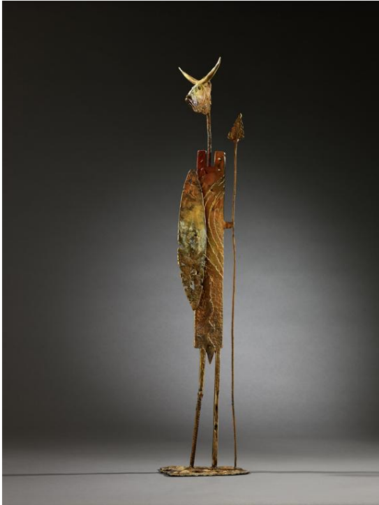
Bronze, patine, 110 x 24 x 15 cm