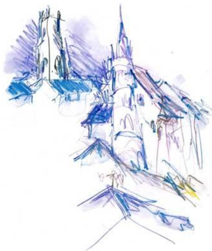
Bourg, 40 x 30 cm, technique mixte sur papier