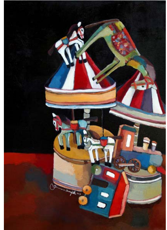
Nature morte, 70 x 50 cm, huile sur toile

Parmi ses sujets préférés il y a ses personnages tirés par le monde du théâtre, des marionnettes, chevaux à bascule, jouets, carillons, objets du quotidien, représentés et savamment dessinés dans une dimension au-delà du temps et d'un espace bien défini.... »