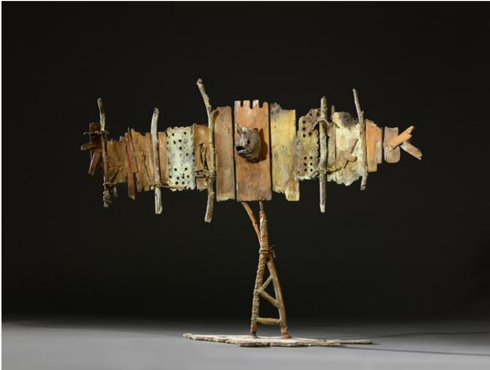
Bronze, patine, 47.5 x 66 x 20 cm