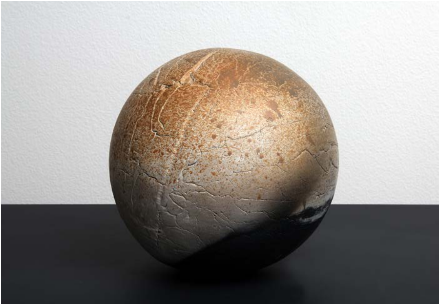
Inspirée des planètes, sphère, raku