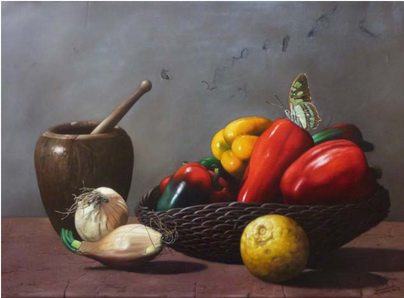
Bodegon con pimientos, 60 x 80 cm, huile sur toile