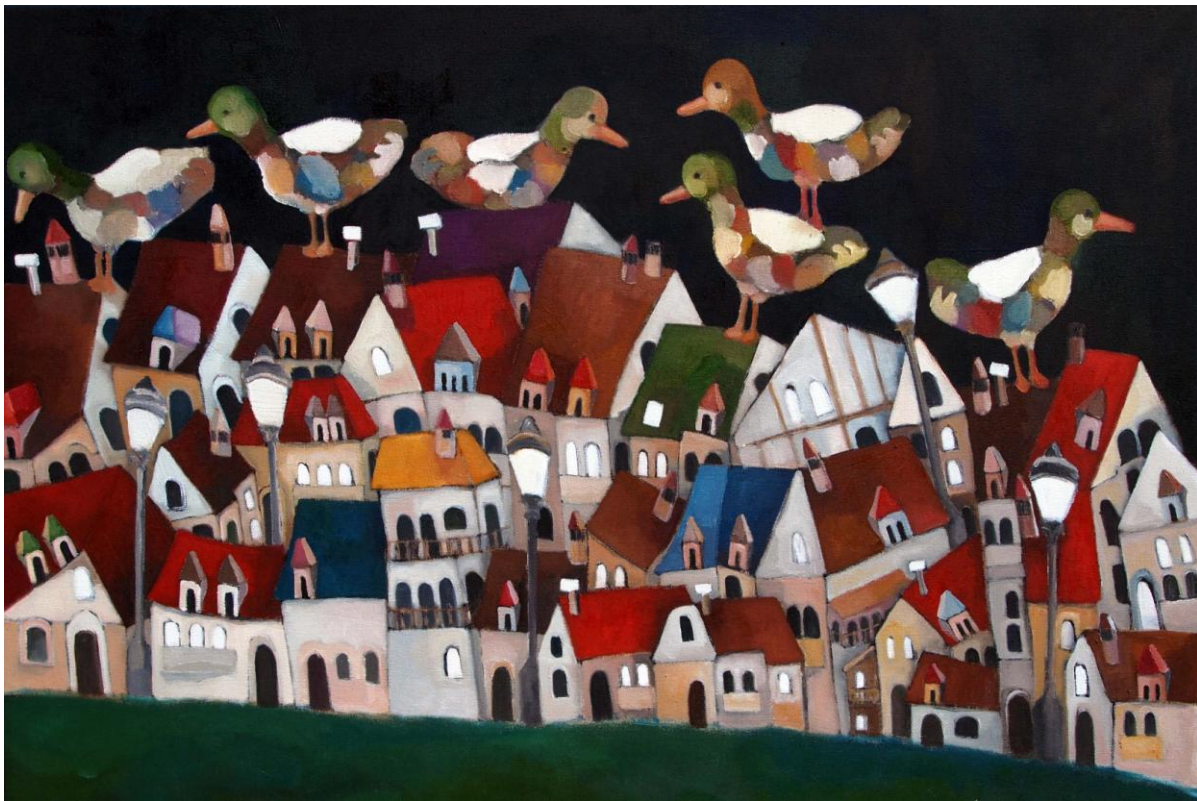
Les canards de la Sarine, 85 x 125 cm, huile sur toile