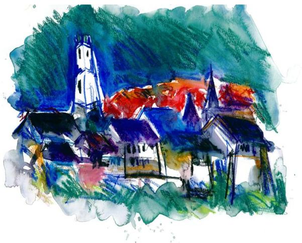
Bourg, 40 x 50 cm, technique mixte sur papier