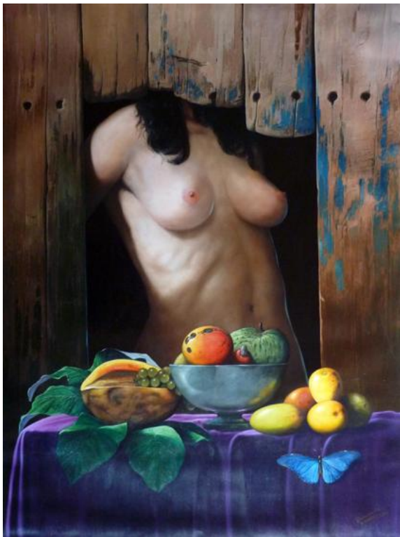
Sin titulo, 120 x 90 cm, huile sur toile