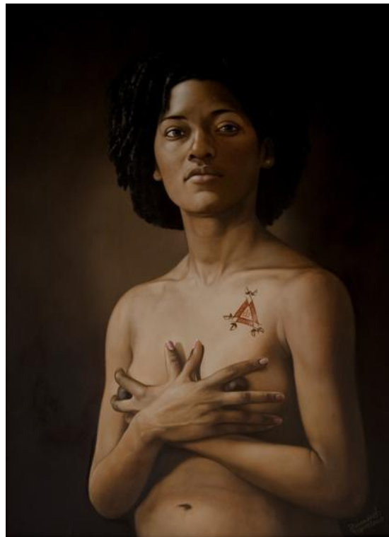
Montecristo, 100 x 70 cm, huile sur toile