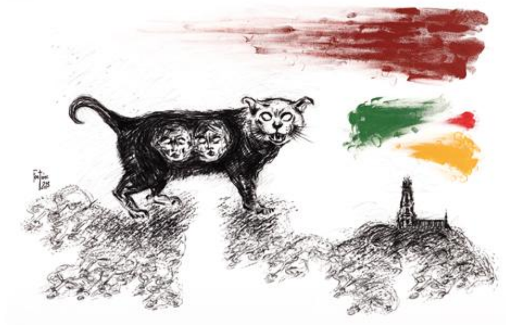
Songe, 2013, 80 x 110 cm, technique mixte sur papier