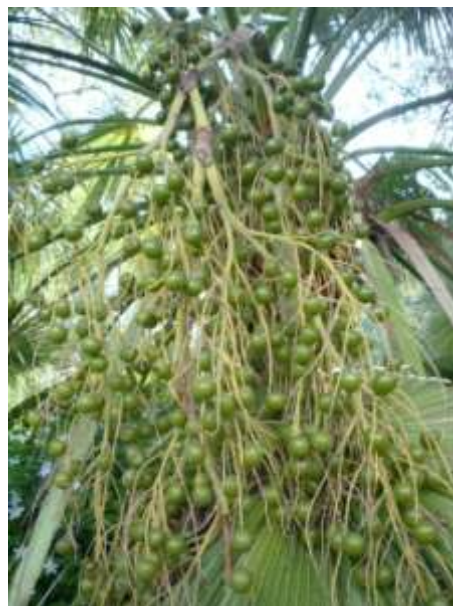
Les dattes vertes (bousr).