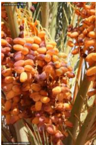
Les dattes mures (balah)

Les dates vertes sont chaudes, les dattes mûres sont froides, les unes et les autres donnent du ton à l'estomac.