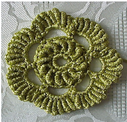
Diagramme de la fleur bullion

Mamita : http://aufildemafantaisie.over-blog.com