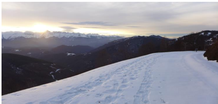
Avec le soleil, le ciel prend les couleurs d'une année nouvelle... Ariège et Mont Valier, janvier 2014