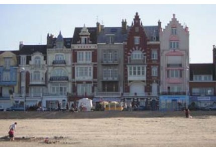
Ses côtes de sable fin

2/ tu le sais on pleure deux fois pour notre région... une fois quand on y arrive et une fois quand on la quitte ;-) Rejoins nous en avril 2012 à Arras et tu auras envie d'en savoir plus sur