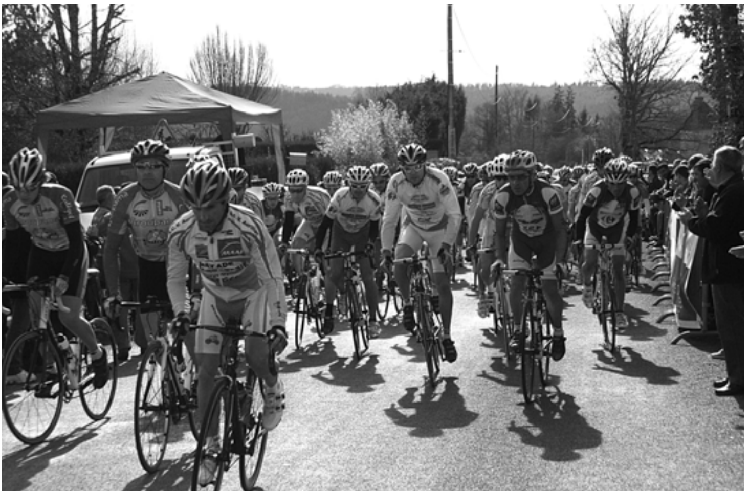
Départ Challenge René Issiot