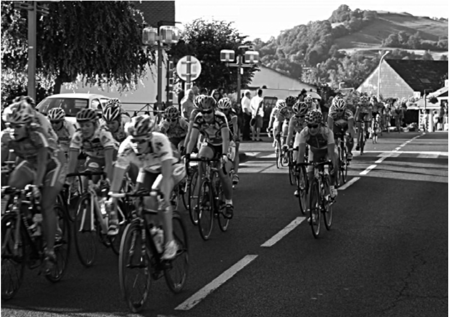
Arpajon 2010 le départ

Depuis 32 ans déjà, le Vélo Club Sansac Arpajon est présent sur toutes les routes de France. Sa politique de formation qui produit chaque saison des coureurs de bon niveau, est désormais connue et reconnue. Pour affirmer sa notoriété et poursuivre dans la voie qu'il s'est tracée, le VCSA bénéficie du soutien des artisans, commerçants et sponsors qui agrémentent cette plaquette. Aussi pour les remercier et les encourager dans cette démarche accordez-leur votre confiance en les privilégiant lors de vos achats ou de vos travaux.