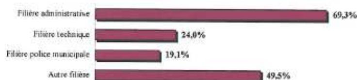
Graphique 19. Taux de féminisation (en %) des agents affectés aux activités de prévention et de sécurité selon la filière d'emplois (hors emplois aidés).

La filière administrative est la filière où le taux de féminisation est le plus élevé (69,3 %). En revanche, les femmes sont très faiblement représentées dans les filières techniques (24 %) et de police municipale (19,1 %).