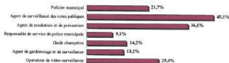
Graphique 23. Taux de féminisation des métiers de la famille professionnelle Prévention et sécurité (en %).

Parmi les sept métiers de la famille professionnelle Prévention et sécurité, la part des femmes est relativement importante chez les agents de surveillance des voies publiques : elles représentent 45,1 % des effectifs. A l'inverse, elles sont particulièrement peu représentées parmi les responsables de services de police municipale (9,1 %).