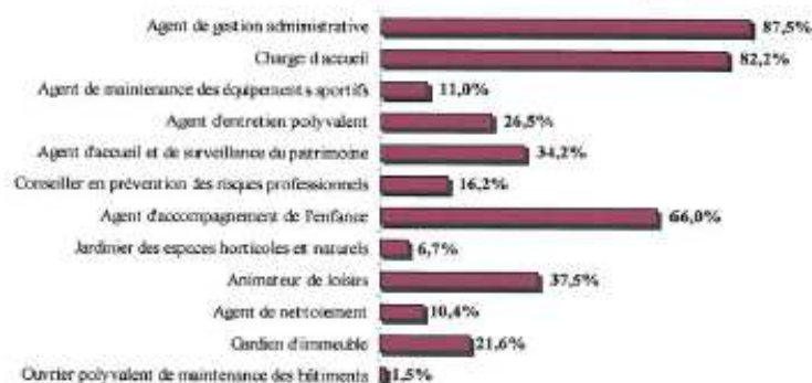
Graphique 24. Taux de féminisation des métiers administratifs et technique des agents affectés aux missions de la prévention et de la sécurité » (en %).

Les femmes sont nombreuses parmi les agents de gestion administrative (87,5 %), parmi les agents chargés d'accueil (82,2 %) ou encore parmi les agents d'accompagnement de l'enfance (66 %). Au contraire, dans les métiers techniques, elles le sont beaucoup moins. Par exemple, 1,5 % des ouvriers polyvalents de maintenance des bâtiments et 6,7 % des jardiniers des espaces horticoles et naturels sont des femmes.