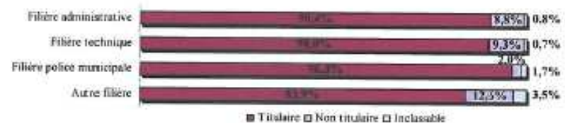
Graphique 18. Répartition des agents (en %) affectés aux activités de prévention et de sécurité selon la filière d'emplois et selon le statut (hors emplois aidés).

Comparativement aux agents des autres filières, les agents affectés aux missions de prévention et de sécurité de la filière police municipale compte la plus grande part de titulaires (96,3 % des agents). Par contre, les non titulaires y sont particulièrement peu représentés (2 %).