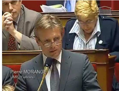
Docteur Pierre MORANGE, Député des Yvelines Maire de CHAMBOURCY

Alors que certains syndicats tentent de repomper les projets du SDPM, lui seul est vraiment actif pour que la pénibilité du travail des policiers municipaux soit reconnue et qu'ils puissent partir en retraite de manière anticipée, notamment au travers du Compte Epargne Pénibilité ( lire ici ).