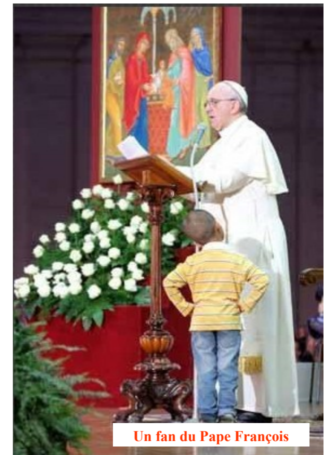
Un fan du Pape François