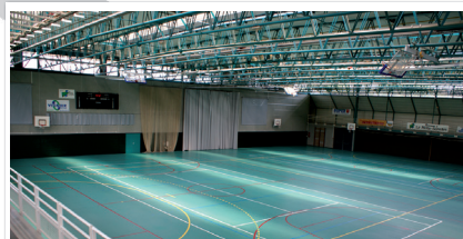
La Halle des Sports Didier Parpillon se situe à 10 minutes à pied du Centre d'hébergement Sainte-Anne