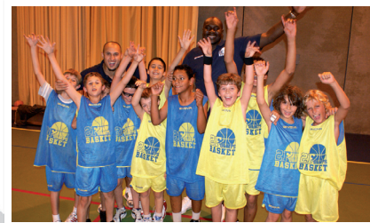
Une ambiance conviviale et détendue

Des activités de pleine nature sont proposées aux stagiaires : via ferrata, baignade, canyoning, randonnée pédestre, escalade, accrobranche, randonnée kayak... Ils s'inscrivent selon leurs goûts !