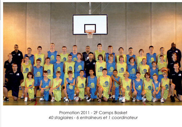
Promotion 2011 - 2F Camps Basket 40 stagiaires - 6 entraîneurs et 1 coordinateur

Lacs : Bourget & Aiguebelette Massif de l'Épine & des Bauges