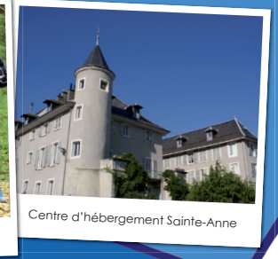
Centre d'hébergement Sainte-Anne