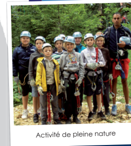
Activité de pleine nature