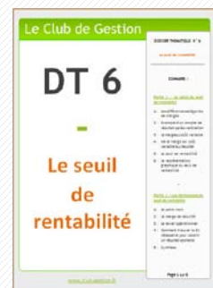
DT6 – Le seuil de rentabilité