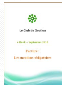
EB1 – Facturation : les mentions obligatoires