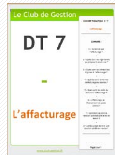
DT7 – L'affacturage