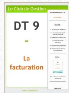
DT9 – La Facturation