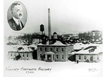
"Mokslinių Centrais" Juni 2002.

Ir 1918, komandiruočių į užsienį, stipendijų stakenturs ir klausimus dintorantams stajimo. Mokslinio darbo kryptis, planus ir ataskaitas, 1,100 orphandijų atskiras dirbamį mokslinių darbų.