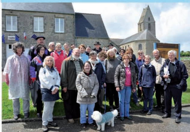
Les visiteurs de l'office de Tourisme de Barfleur