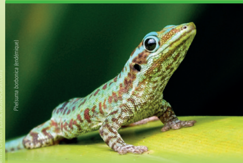
Phelsuma borbonica (endémique)