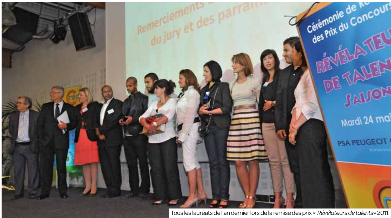
Tous les lauréats de l'an dernier lors de la remise des prix « Révélateurs de talents » 2011.

L'association Créo-Adam organise « Révélateurs de talents », un concours ouvert à tous qui accompagne les porteurs d'un projet de création d'entreprise. Inscrivez-vous vite.