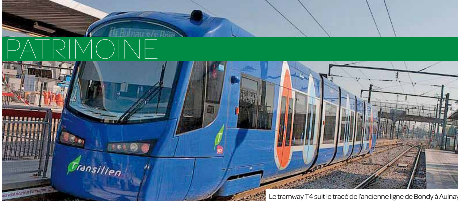
Le tramway T4 suit le tracé de l'ancienne ligne de Bondy à Aulnay.