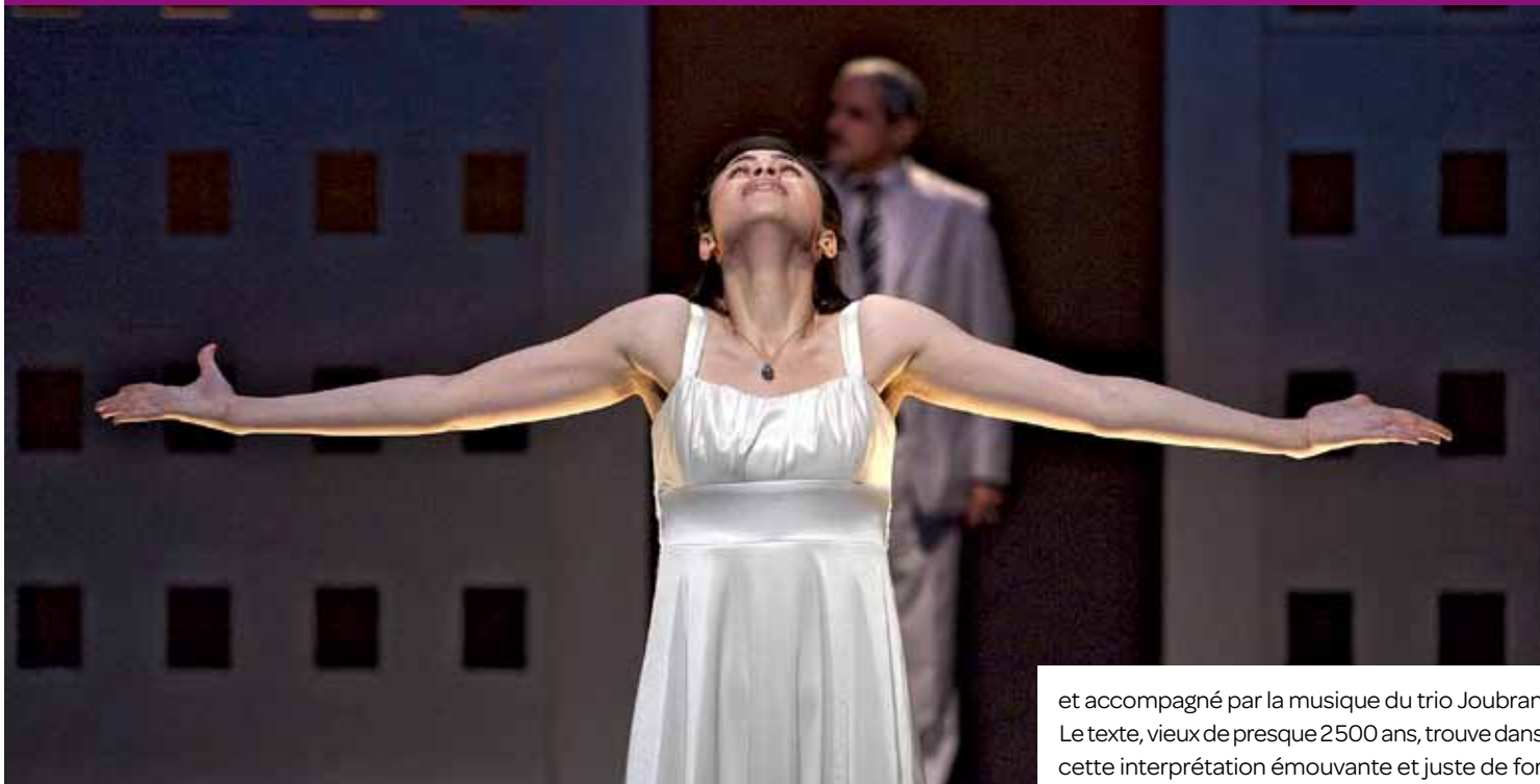
À Prévert, Antigone de Sophocle, une tragédie interprétée en arabe et surtitrée en français.