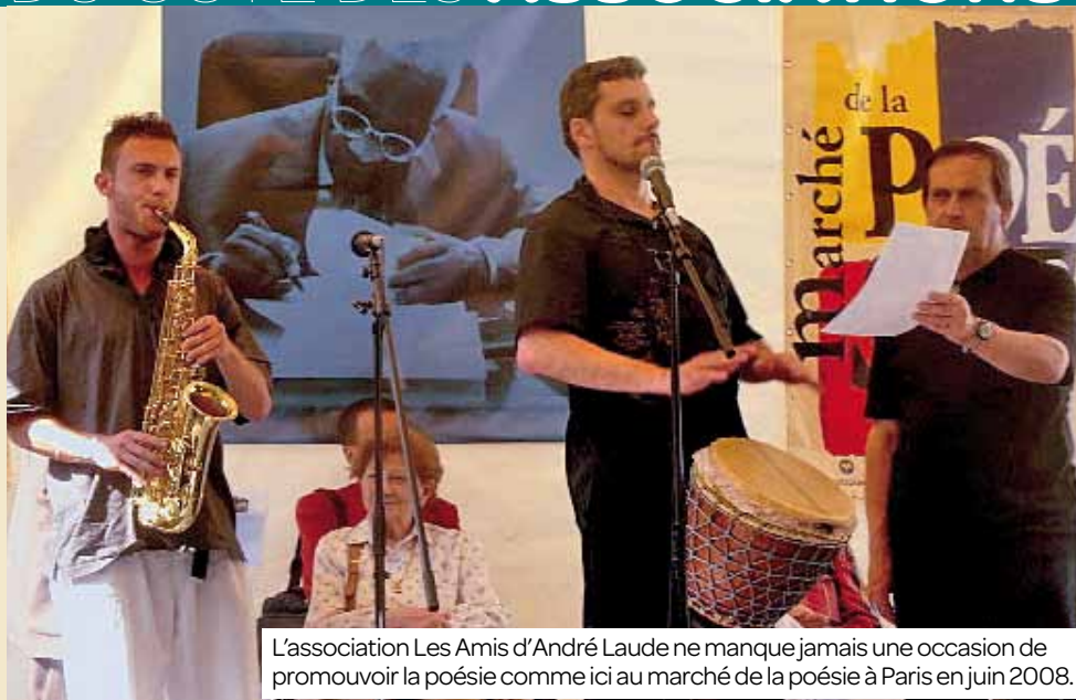
L'association Les Amis d'André Laude ne manque jamais une occasion de promouvoir la poésie comme ici au marché de la poésie à Paris en juin 2008.