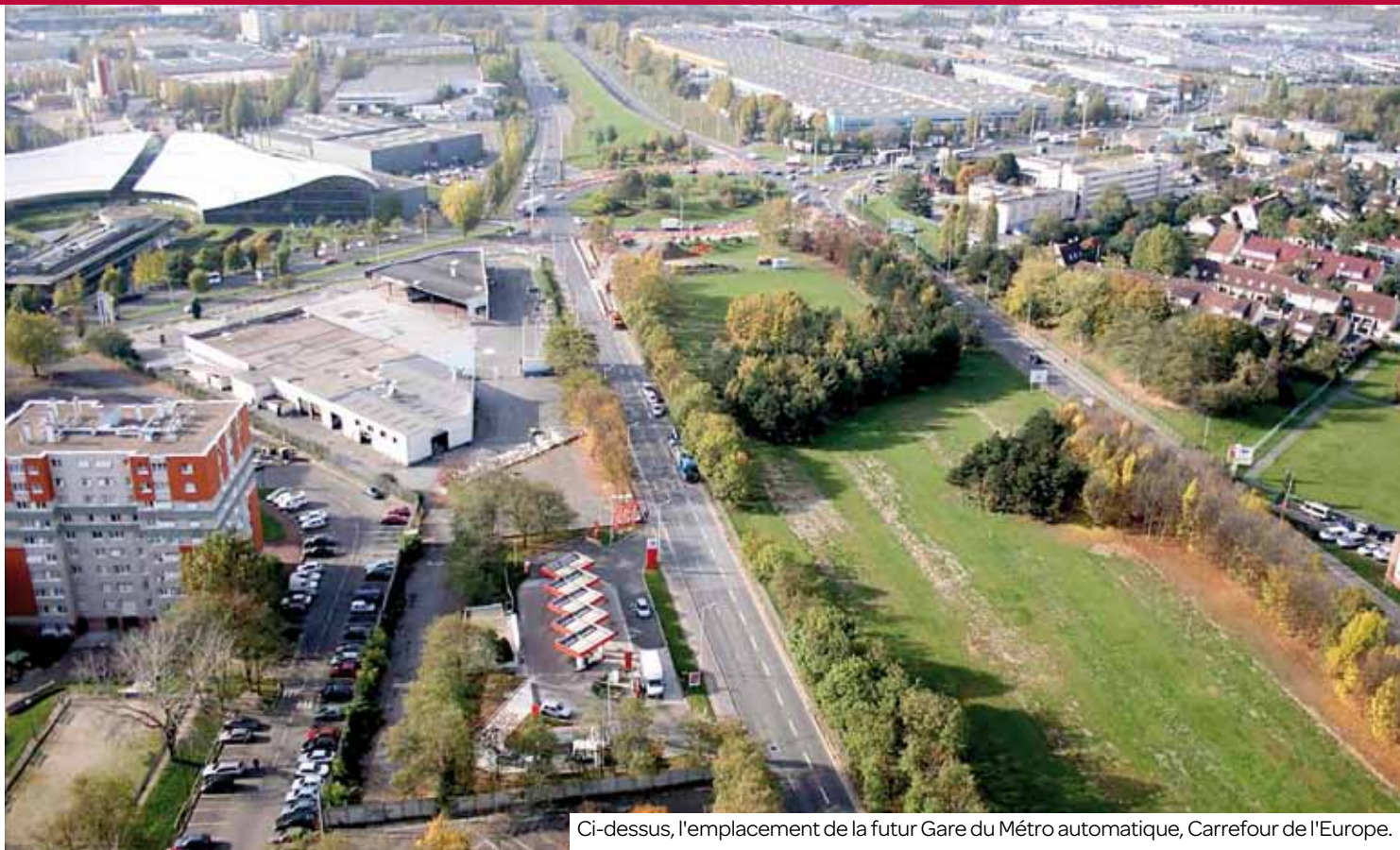
Ci-dessus, l'emplacement de la futur Gare du Métro automatique, Carrefour de l'Europe.