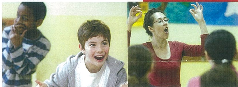
Interventions du CRÉA en milieu scolaire.

L'objectif de ce nouveau projet est de partager l'expérience de la structure dans une dimension pluricatégorielle. Au niveau local, deux cycles de 16 séances sont proposés aux personnels de la petite enfance, mission handicap et personnel périscolaire de la Ville.