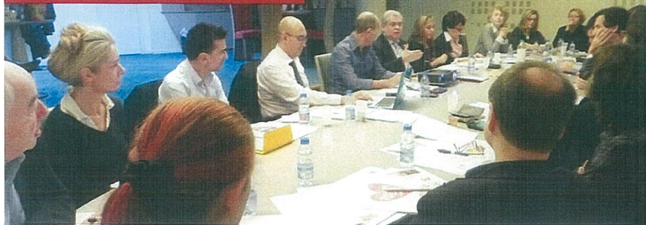
Les Ambassadeurs du CRÉA réunis à la Cité de la Musique le 30 novembre dernier.