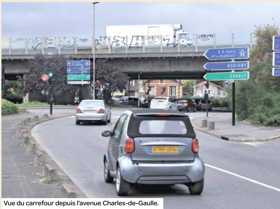
Vue du carrefour depuis l'avenue Charles-de-Gaulle.

Le comité de dénomination des rues souhaite rebaptiser ce carrefour dont le surnom est jugé désormais singulièrement dépréciatif.