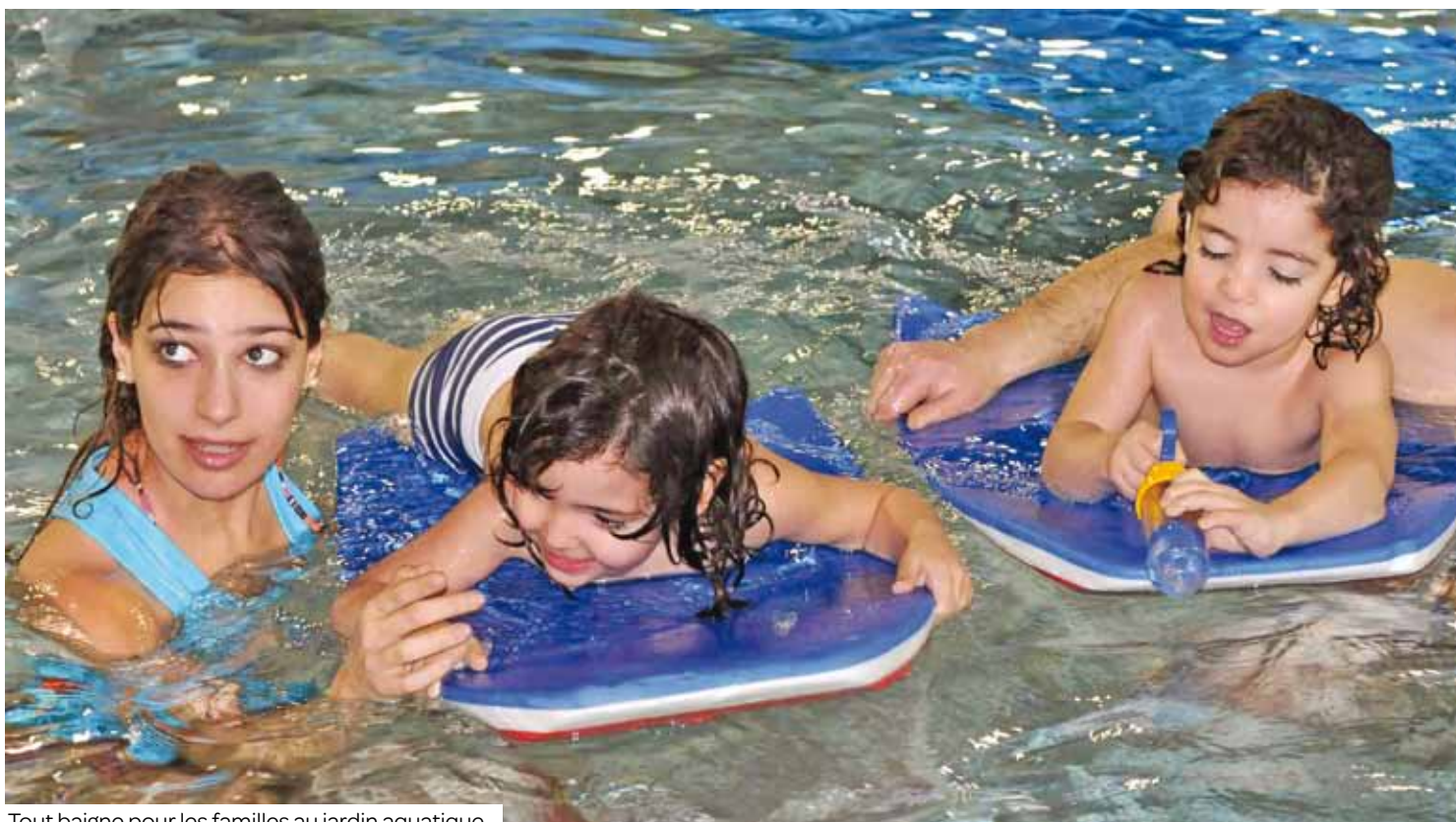
Tout baigne pour les familles au jardin aquatique.

Entre les bébés nageurs et les activités d'Aulnay sport natation, le jardin aquatique est une bonne manière pour les enfants de 3 à 5 ans d'apprivoiser l'élément liquide en famille. Il reste des places.