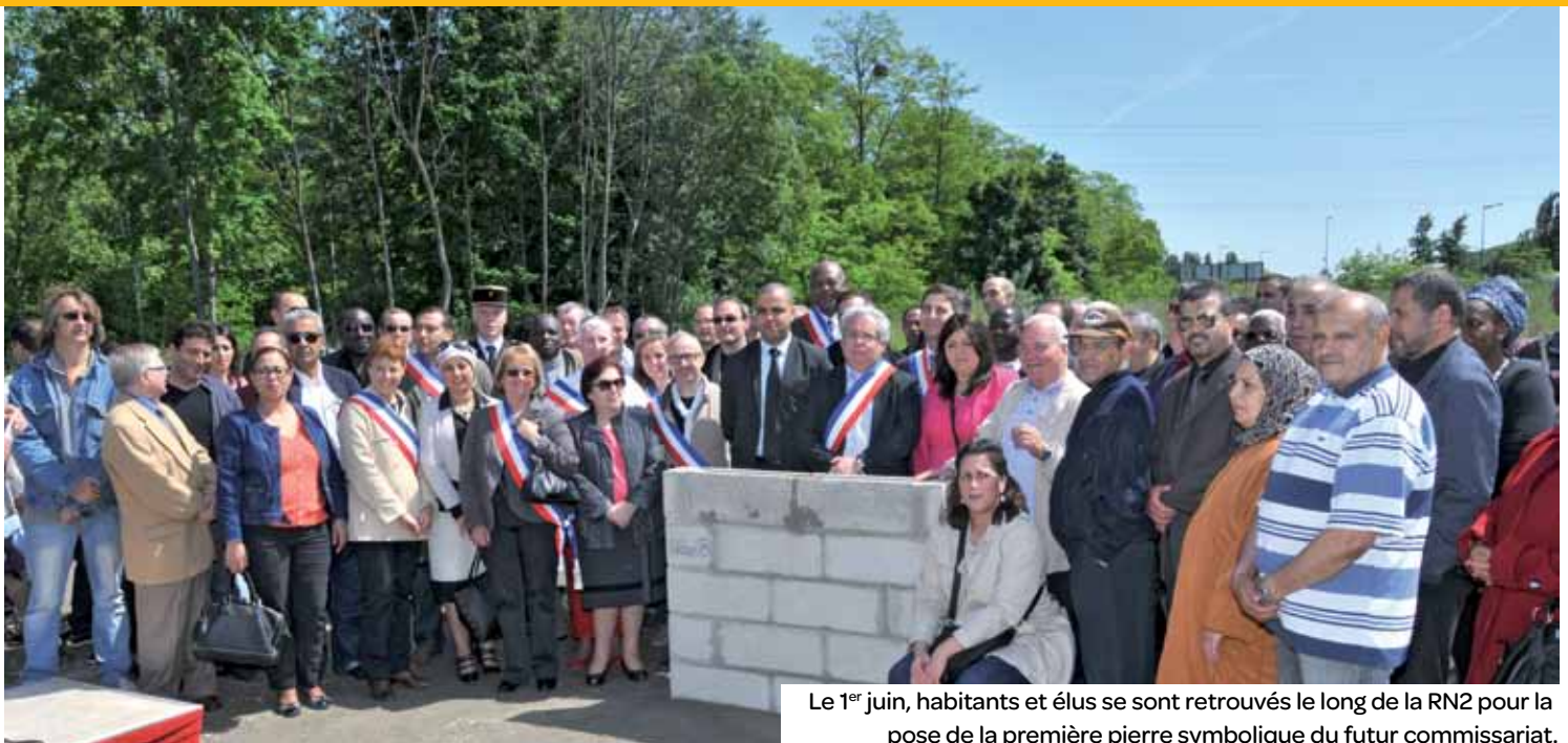
Le 1 er juin, habitants et élus se sont retrouvés le long de la RN2 pour la pose de la première pierre symbolique du futur commissariat.