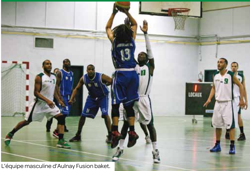
L'équipe masculine d'Aulnay Fusion basket.