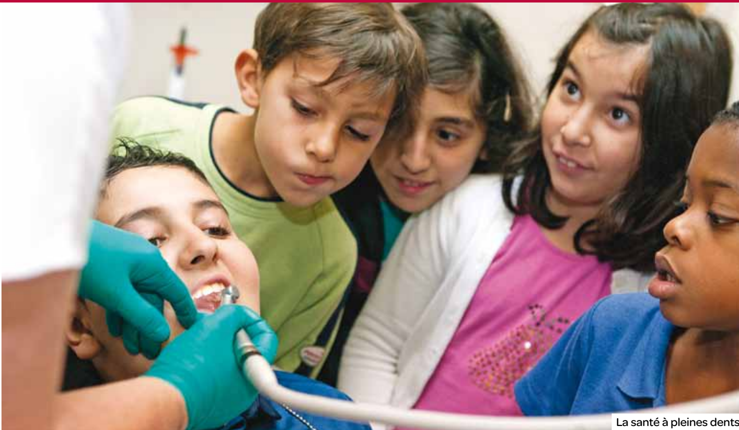
La santé à pleines dents.