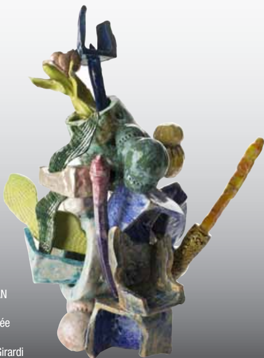
Patrick LOUGHRAN Be-bop , 2013 Terre cuite émaillée 70 x 53 x 43 cm