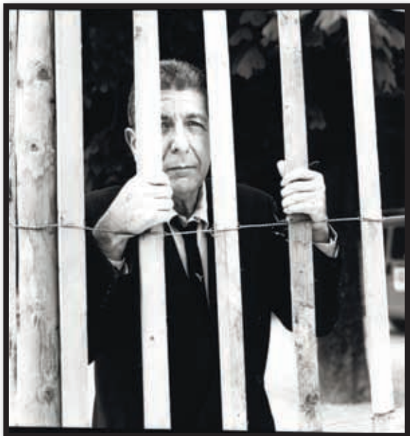
Renaud MONFOURNY - Léonard Cohen , 1994 Tirage photographique argentique - Noir et blanc - 30x40 cm