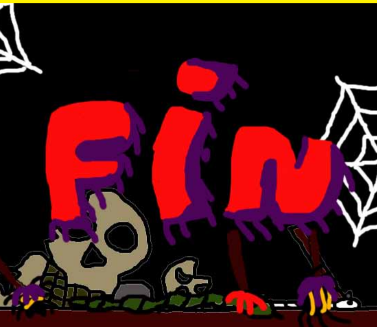
ILLUSTRATION BANDE DESSINÉE INFOGRAPHIE