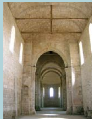
Nef charpentée de Saint-Savinien