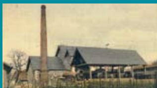
Laiterie coopérative de Lezay

➔ Salle de réunion de la bibliothèque, Lezay