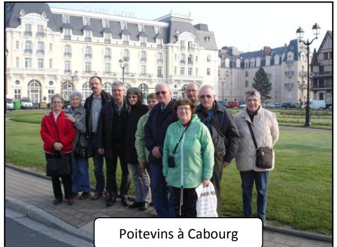
Poitevins à Cabourg