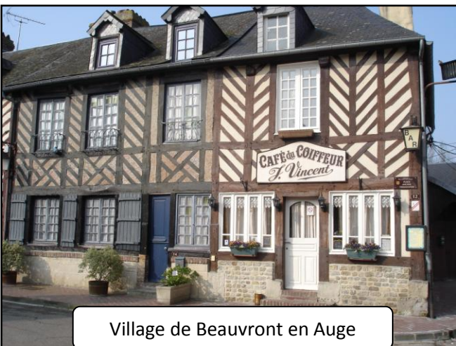
Village de Beauvront en Auge