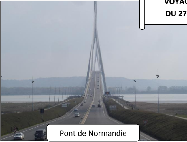
Pont de Normandie