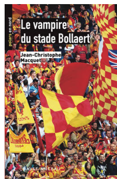
La collection « Polars En Nord »