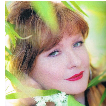
Catherine Jacob