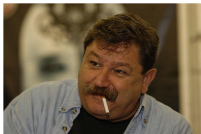
Paco Ignacio Taibo II