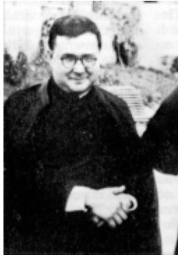
Mons. Escrivá de Balaguer, fundador del Opus Dei, en una foto de su juventud

“no llegue nunca este cristiano [el miembro del Opus Dei] a creer o decir que baja del templo al mundo para representar a la Iglesia, ni que las soluciones que da a estos problemas [temporales] son las SOLUCIONES CATÓLICAS. No... ¡eso no es posible! Eso sería clericalismo”... [ibidem, n° 116-177]. Y también: “Yo no hablo nunca de política. Yo no pienso que la misión de los cristianos sobre la tierra sea la de dar nacimiento a una corriente político-religiosa (eso sería una locura)” [Homilía, n° 3, pág. 26].