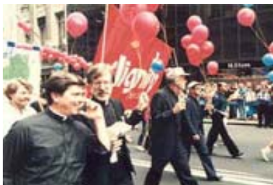
Marcha del «orgullo gay» por las calles de Nueva York

(un punto que involucrará tanto a profesores de seminarios, como a estudiantes). 3º) Si su orientación homosexual es lo suficientemente “fuerte, permanente y unívoca” como para poner en riesgo un ámbito totalmente masculino. (...)