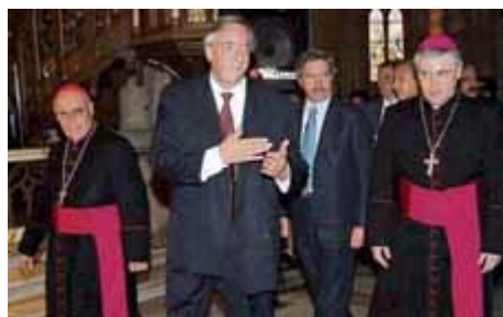
N. Kirchner en la Basílica de Luján, a su lado los obispos del Vaticano II...

Asombro y vergüenza . Causa asombro y vergüenza la actitud del presidente de la Nación con sus dichos y agresiones