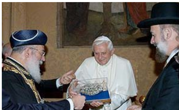
Benedicto XVI con los rabinos

«El Papa recibió a rabinos israelíes. Le pidieron que aliente la difusión de un viejo documento del Vaticano que repudia el antisemitismo. Los dos grandes rabinos de Israel visitaron hoy al papa Benedicto XVI y lo exhortaron a condenar la profanación de sinagogas y otras formas de antisemitismo. También le pidieron que aliente a los sacerdotes y obispos del mundo a dedicar un día del año a las enseñanzas de un documento del Vaticano que repudia el antisemitismo en todas sus formas. Yona Metzger y Shlomo Amar llegaron a la residencia pontificia de verano en Castelgandolfo para hablar con Benedicto XVI sobre la necesidad de difundir más las enseñanzas del documento Nostra Aetate , aprobado por el Concilio Vaticano II en 1965, explicó el embajador israelí Oded. En ese documento, el Vaticano deplora el antisemitismo en todas sus formas y repudia la acusación de deicidio que culpaba a los judíos como pueblo por la muerte de Jesús. La idea de la culpa de los judíos había alimentado el antisemitismo durante siglos. El Pontífice respondió que tratará de responder de manera positiva al pedido de los rabinos, dijo el embajador israelí ante la Santa Sede en conferencia de prensa después de la reunión. El mes pasado, Benedicto visitó la sinagoga central de Colonia, Alemania, en la segunda vez que un Pontífice concurre a un templo judío. En esa visita, Benedicto dijo que el mundo presenciaba la aparición de nuevas formas de antisemitismo». (...) ( Clarín , mes de septiembre).