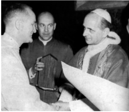
Pablo VI con Roger Schutz, de la comunidad de Taizé

e incluso sin el lenguaje jurídico correcto obligando a todos los sacerdotes y fieles, que es imposible afirmar que haya estado cubierto por la infalibilidad papal respecto de las leyes universales” (7).