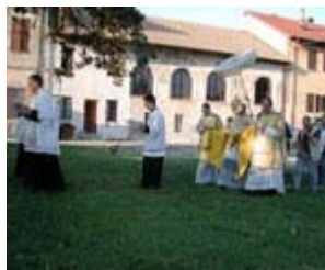
Procesión de Corpus en el Seminario

1) Hará propicio (o hará superar o compensar) el ambiente familiar y formativo, incluidos los aspectos materiales, económicos, etc.