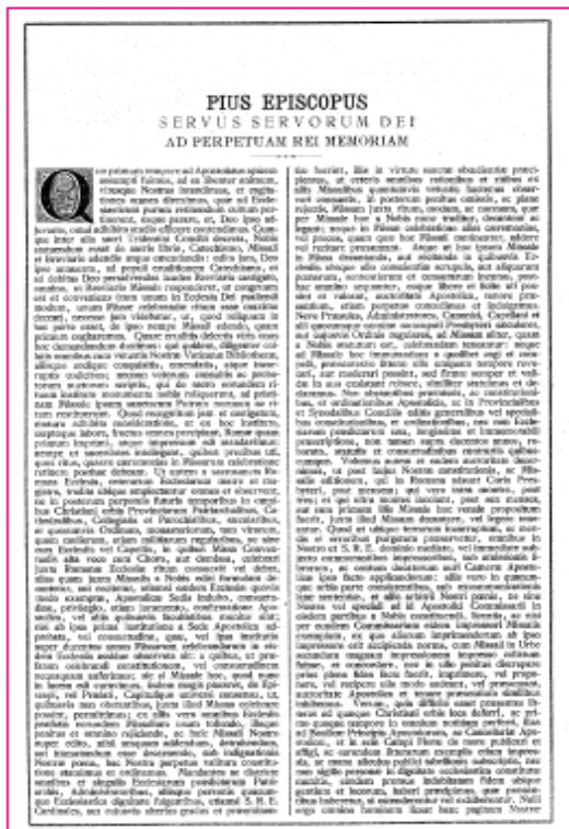
La bula «Quo Primum» de San Pío V, se halla al comienzo de todos los Misales

En lo que respecta a las otras falsas nociones en circulación sobre Quo Primum , serán estudiadas en un próximo artículo.