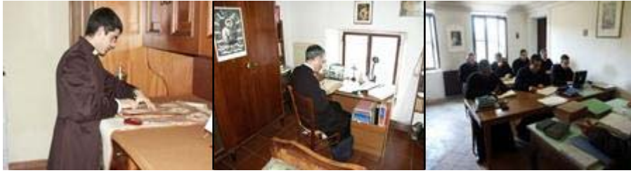
El Seminario: sacristán preparando ornamentos; el estudio personal; seminaristas en clases

sin embargo, “son admitidos también candidatos que no deseando entrar a formar parte del Instituto Mater Boni Consilii , previo acuerdo con su Instituto o grupo sacerdotal o la recomendación de ellos por parte de un sacerdote confiable”, sostengan cuanto se ha dicho sobre la posición doctrinal a adoptar en el Seminario.