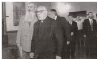
Visita a la «Kehilá»