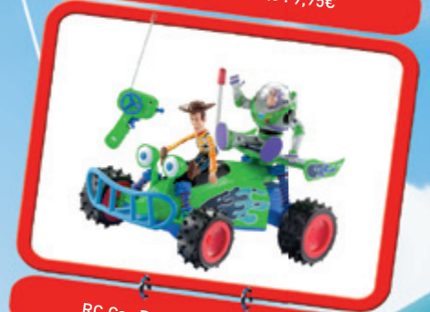
RC Car Buzz & Woody : 39,95€