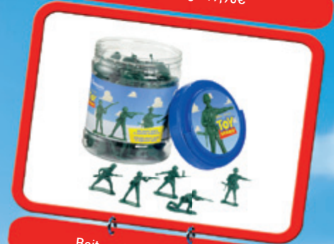
Boîte soldats verts : 9,95€