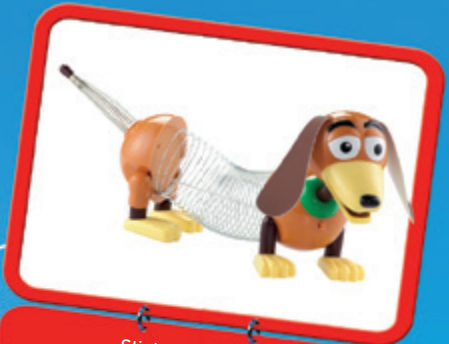
Slinky Dog : 19,90€

Haut...des CADEAUX Disponibles dans les boutiques du Parc Disney