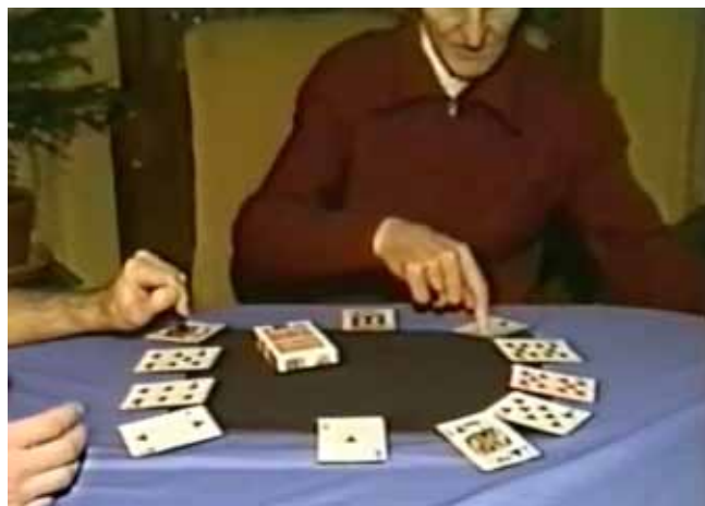
Marlo exécutant « L'Heure Manquante »

Ce DVD sera suivi de trois autres qui paraîtront fin 2011 : Ultimate Marlo 2, 3 et 4 , les 4 DVD formant la « Collection Ultimate Marlo ».