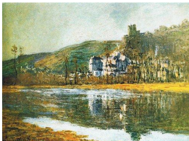
Château de la Roche Guyon – Monet – 1881