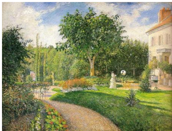
Le jardin des Mathurins – Camille Pissaro – 1876