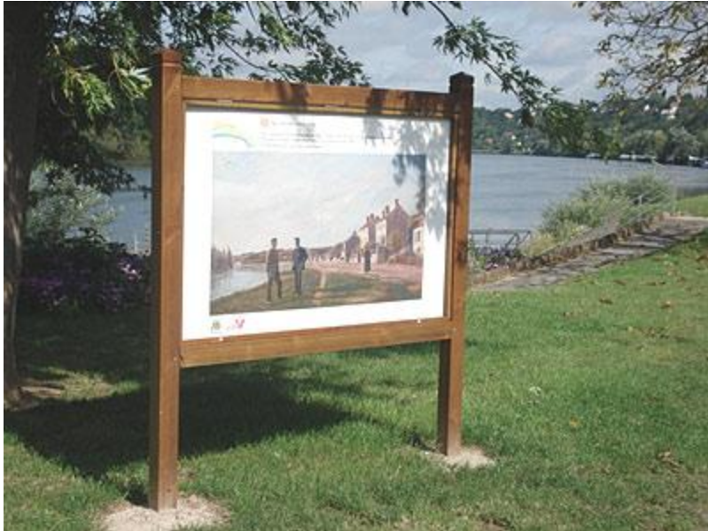
Promenade des Impressionnistes à La Frette sur Seine

Vastes champs, vallées et buttes, allées forestières, bords de l'Oise et de la Seine, chemins, sentiers, ont attiré plusieurs générations de peintres et d'écrivains. Ils ont regardé ces paysages et célébré leur lumière dans une nouvelle manière de peindre. Beaucoup de sites qu'ils ont peints ont été préservés si bien qu'en se promenant au milieu de leurs tableaux nous ne regardons plus comme avant notre environnement familier.