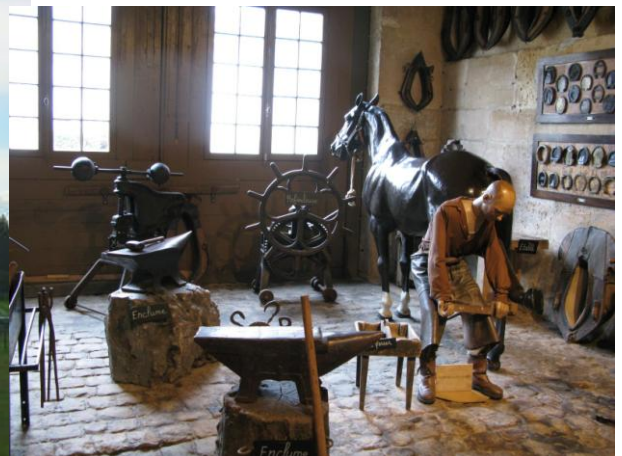
à gauche : Grandes Ecuries vues de l'extérieur à droite : Musée du Cheval