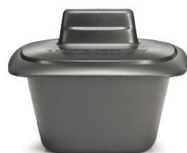
Terrine UltraPro 500 ml

et gagnez un équipement de professionnel !