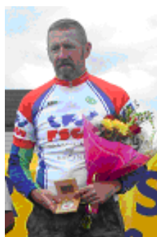
O. Barou Horizon 38