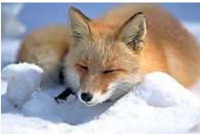
Un jeune renard roux japonais

La sous-espèce japonaise, Vulpes vulpes japonica , serait originaire d'Inde. Il se rencontre couramment en groupe. Il est appelé kitsune en japonais.