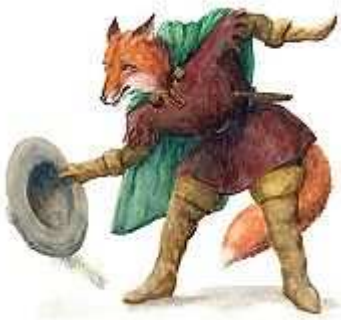
Illustration du Roman de Renart .