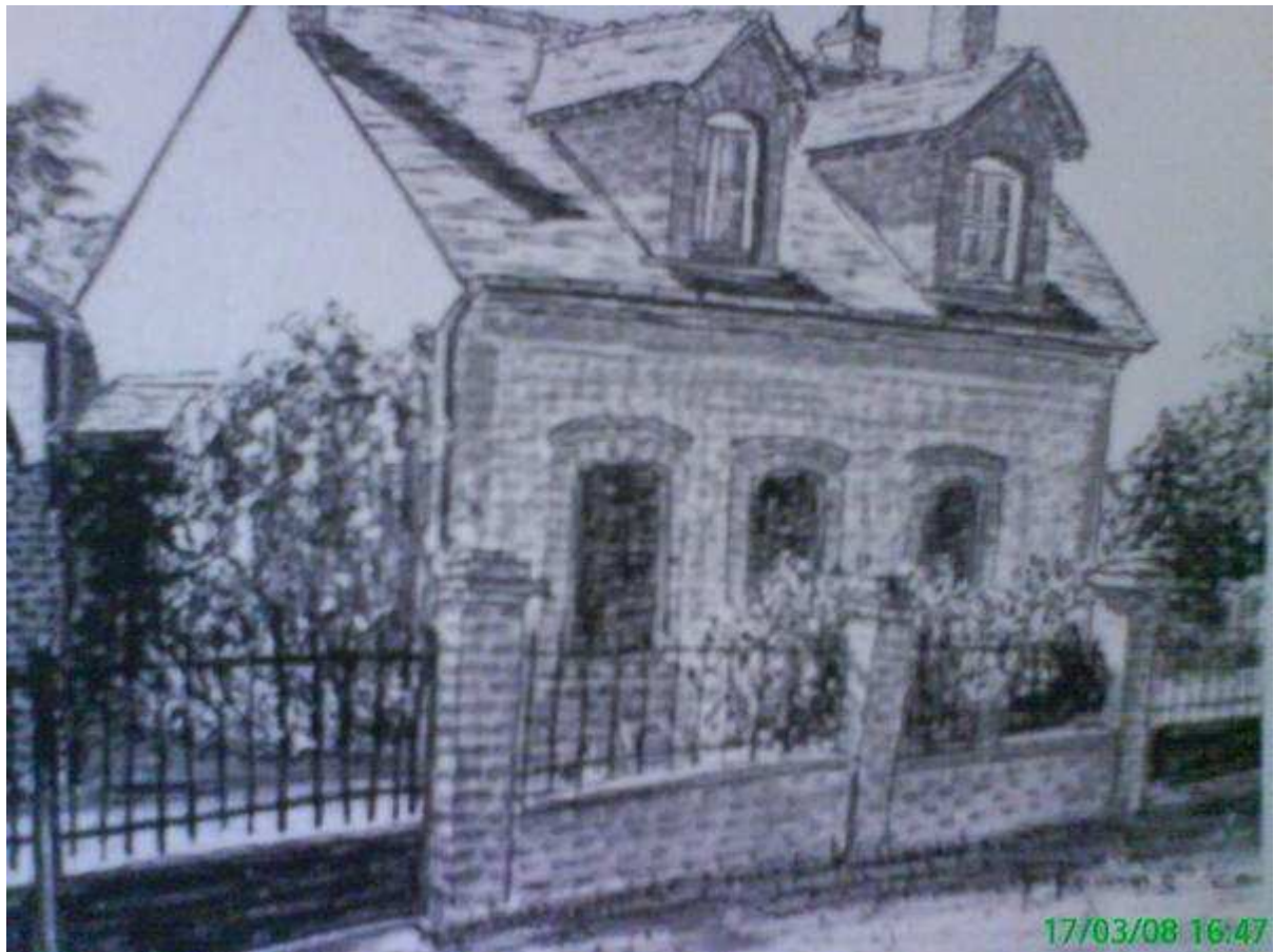
Monochrome d'une maison typique de Sennely.