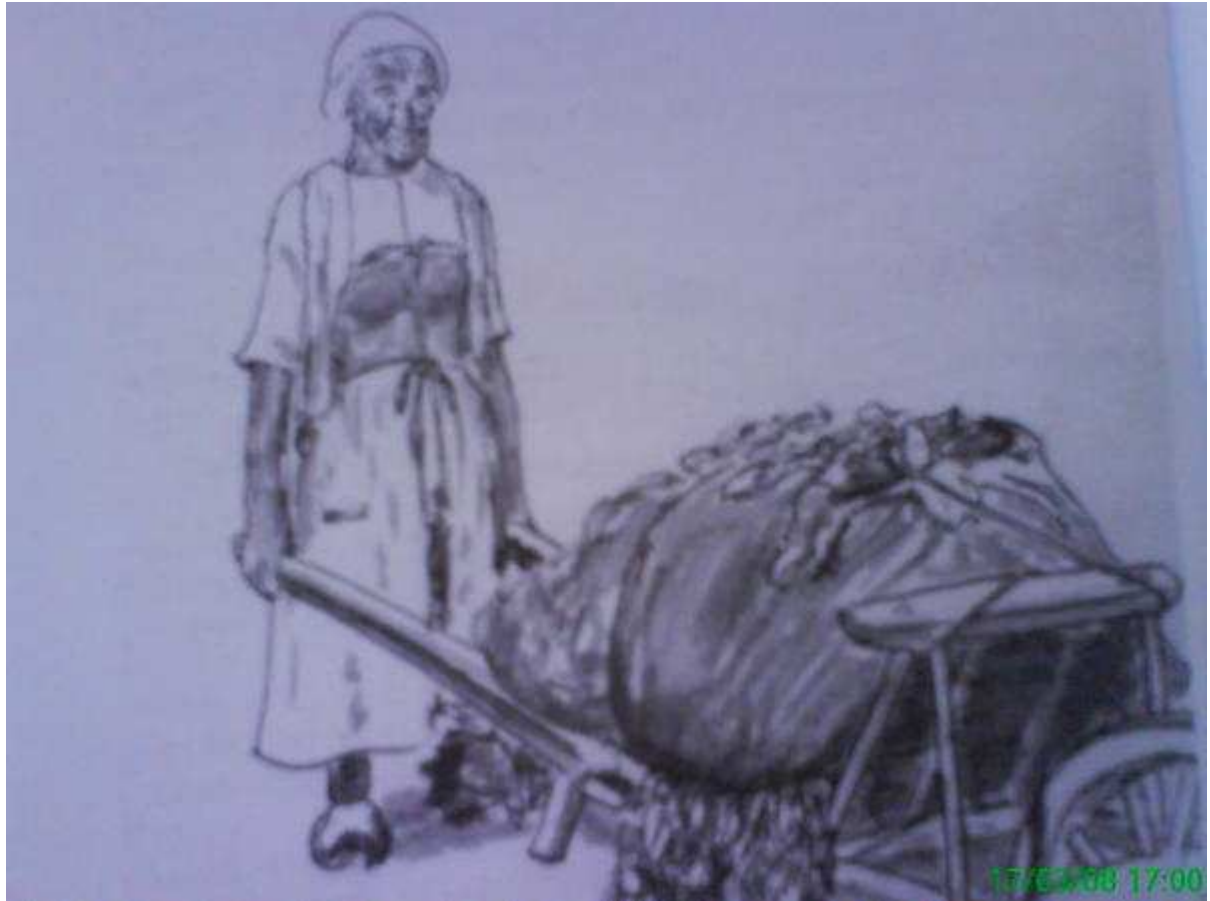
Vieille dame au labour, au début du XXème siècle.