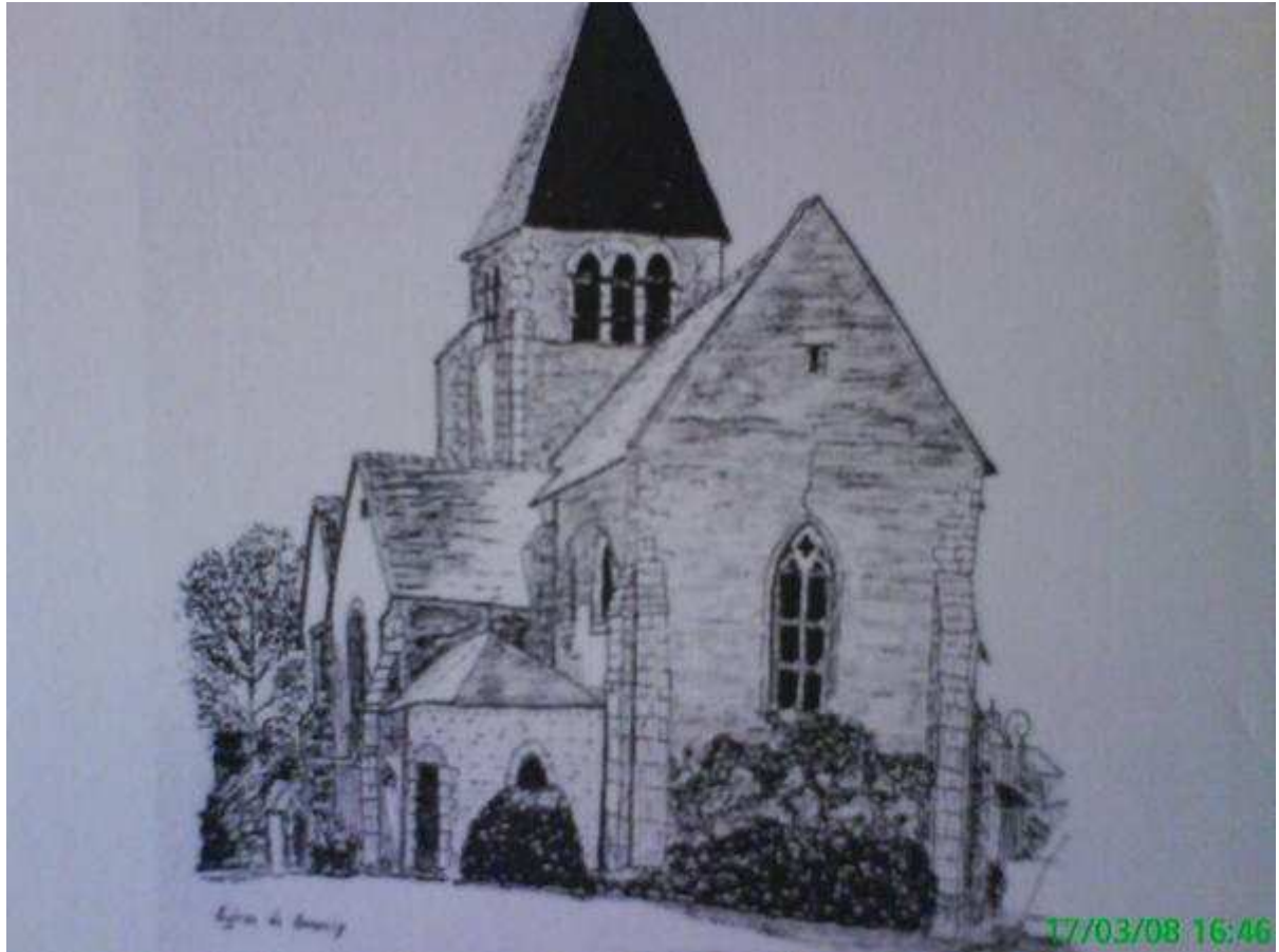
Monochrome de la magnifique église de sennely, si chère à monsieur Savestre.