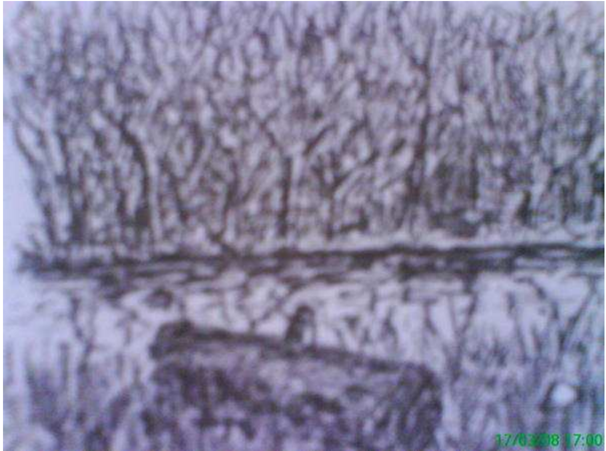
Monochrome d'une bûche flottée, sur les ondes fangeuses d'un étang solognot.