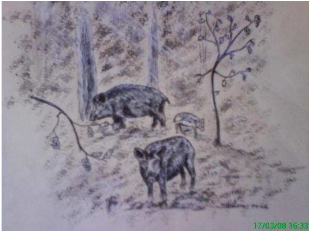
Monochrome de la famille sanglier, réchauffée par les raies roboratives du soleil, transperçant les frondaisons d'un bois de sologne. (Singularis Porcus).