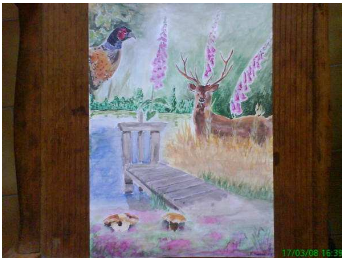
Aquarelle de la couverture du livre.