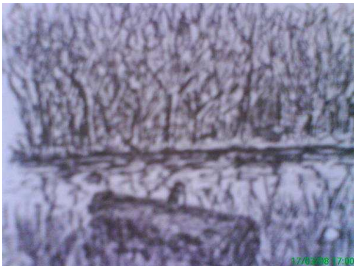
Monochrome d'une bûche flottée, sur les ondes fangeuses d'un étang solognot.