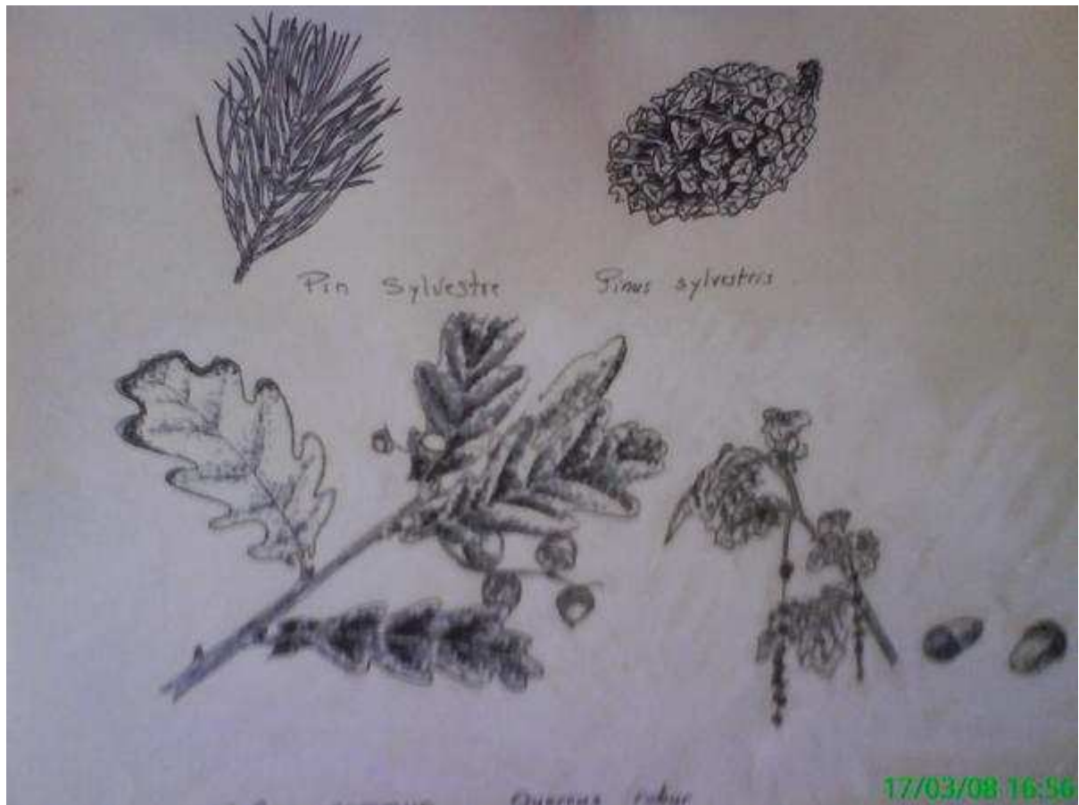
Monochrome d'échantillons botaniques de chêne commun et de pin sylvestre. (Quercus Robur et Pinus Sylvestris).