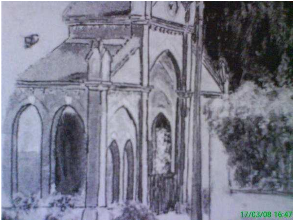
Zoom de l'entrée de l'église de Sennely.