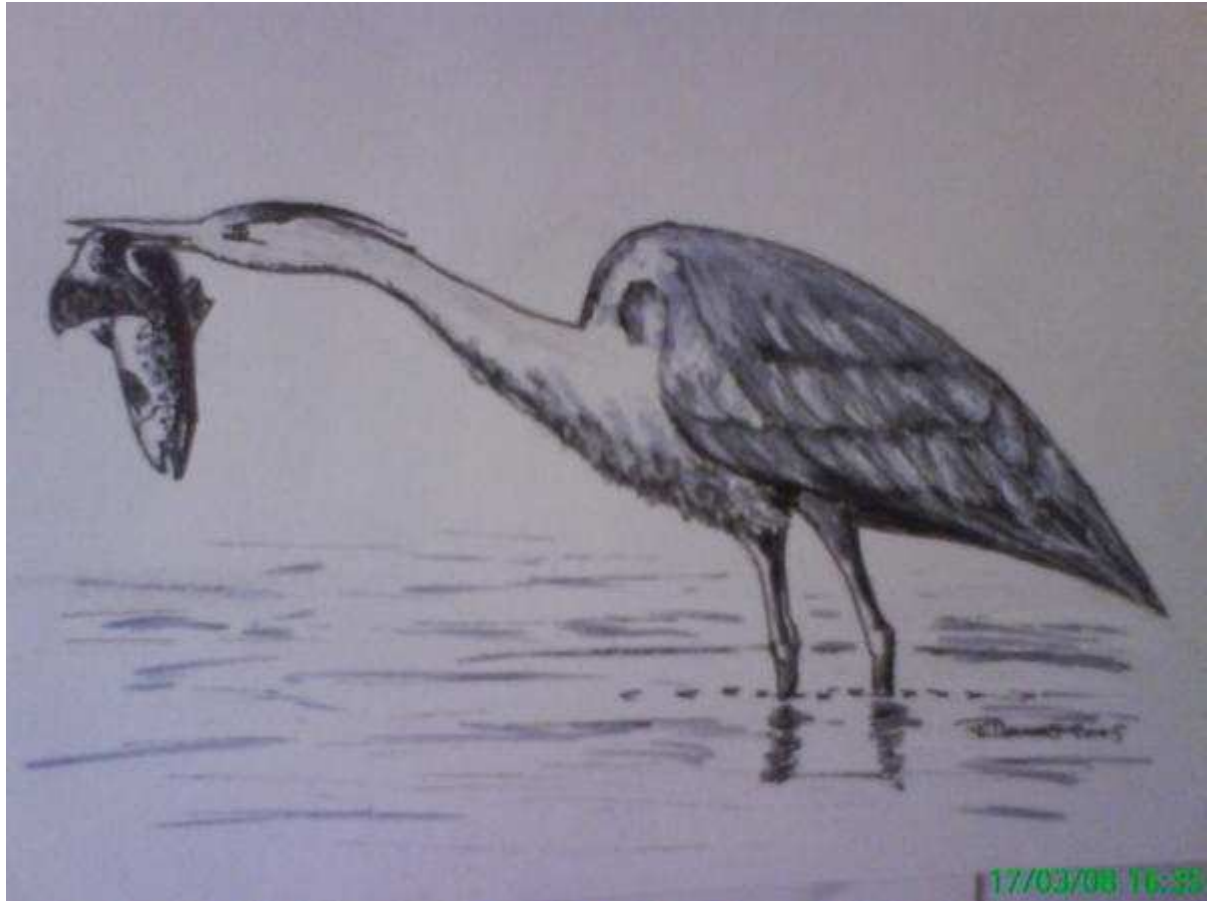
Monochrome d'un héron cendré "à table". (Ardea Cinerea).