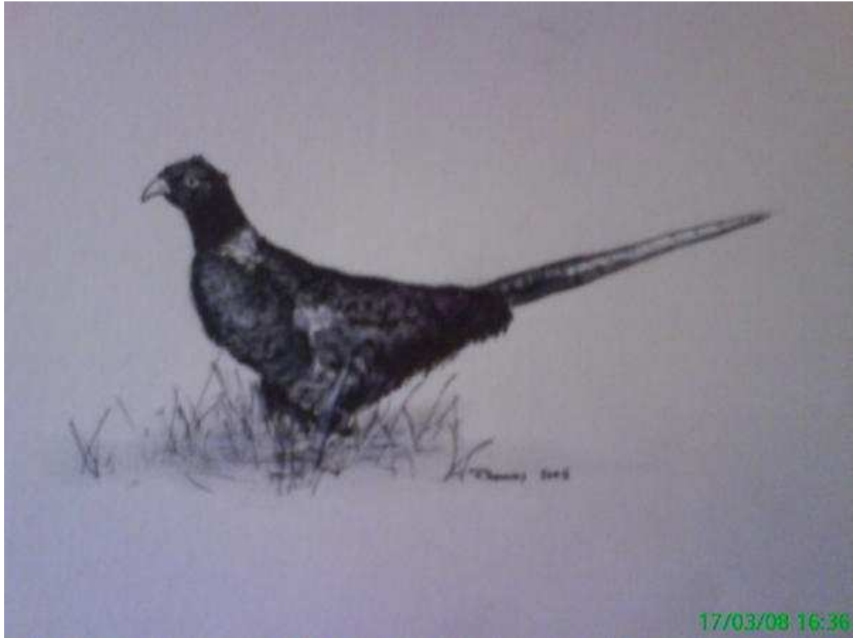
Monochrome d'un fier faisan. (Phasianus Colchicus).