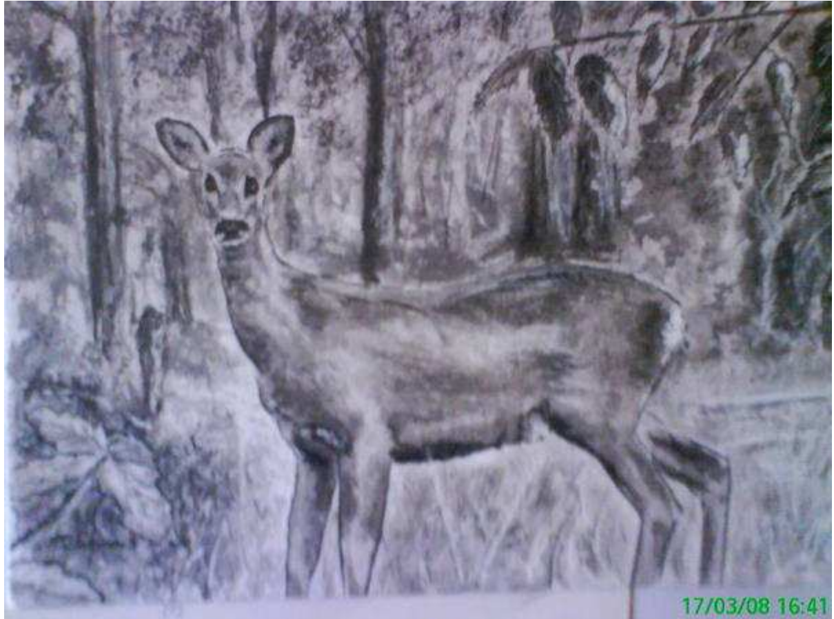
Petit faon à l'affût. (Cervus Elaphus).