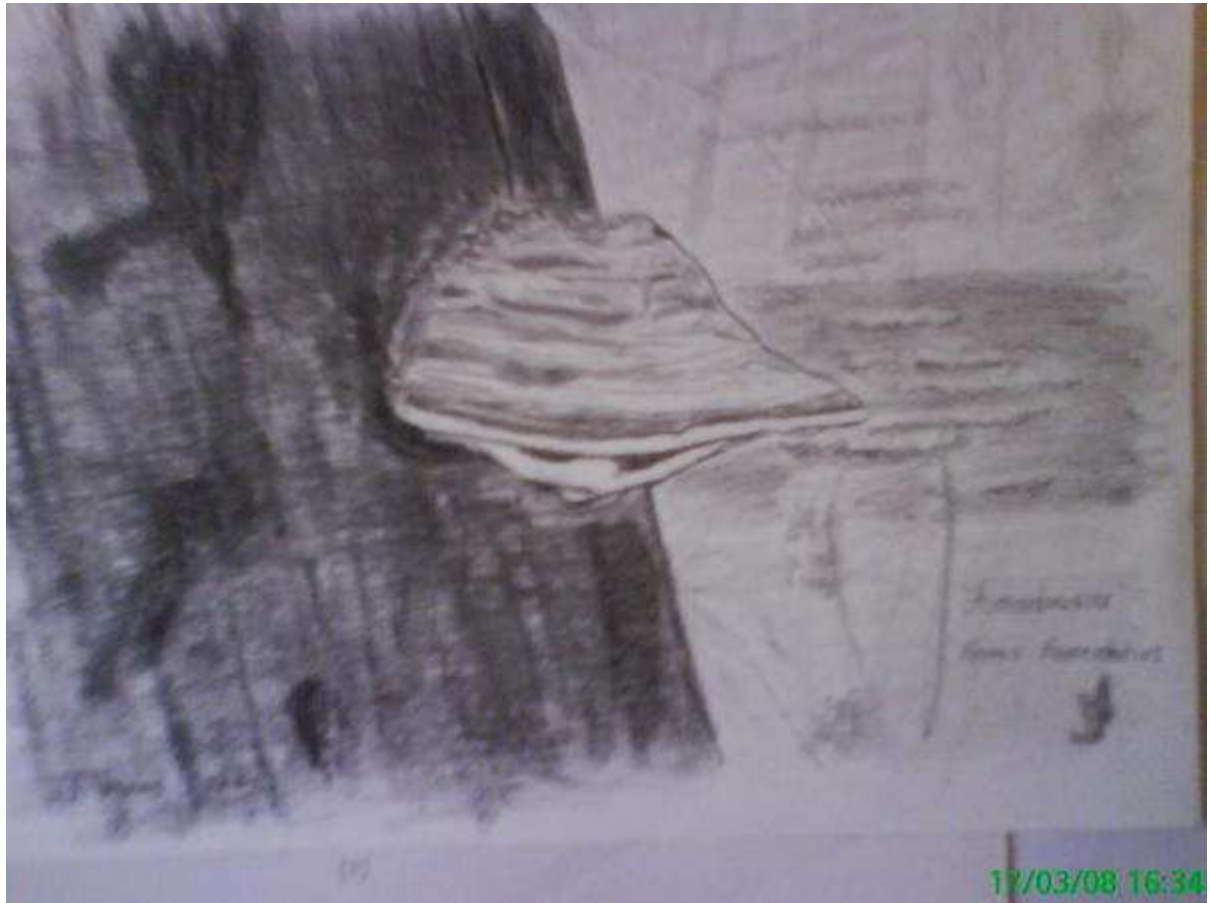
Champignon dimidié: amadouvier. (Fomes Fomentatus).