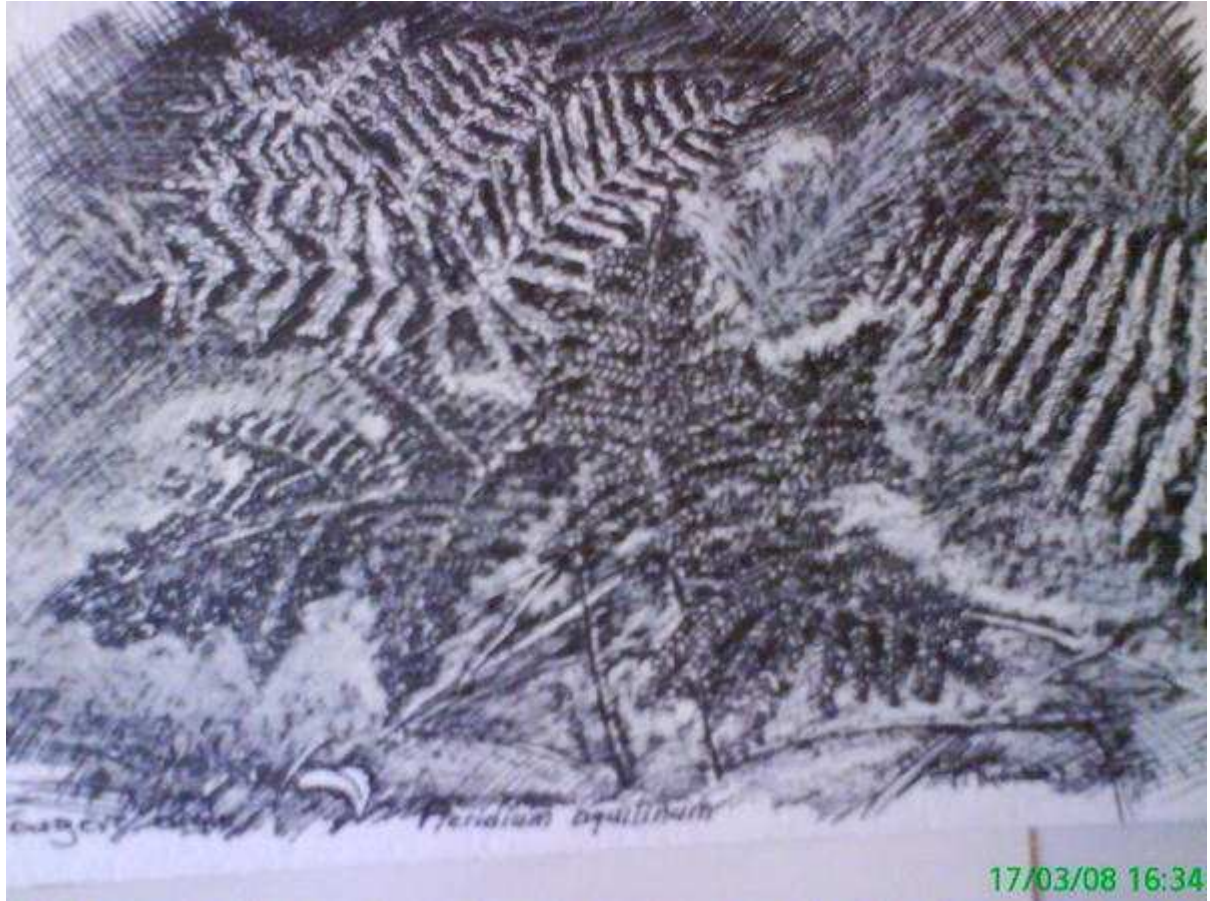
Monochrome d'un bouquet de fougère aigle. (Pteridium Aquilinum).