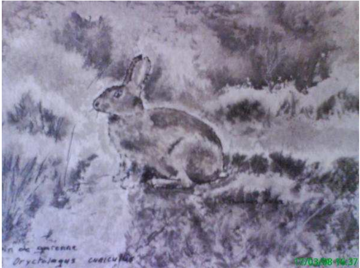
Monochrome d'un lapin de garenne parmi les mousses et bruyères de sous bois. (Oryctolagus Cuniculus).