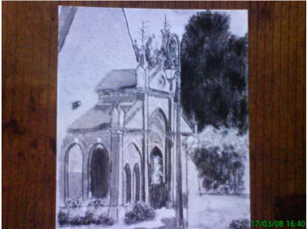
Monochrome de l'entée de l'église de Sennely.