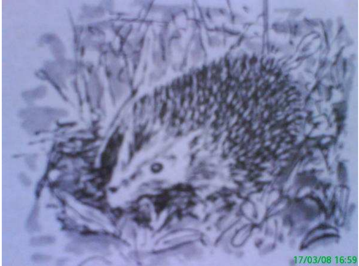
Monochrome d'un hérisson au bord d'une sente. ( Erinaceus europaeus ).