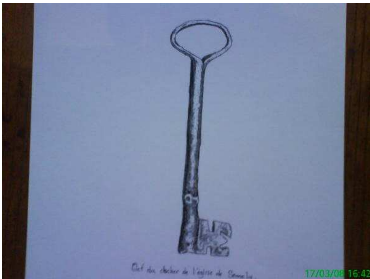
Monochrome de la clef du clocher de Sennely.