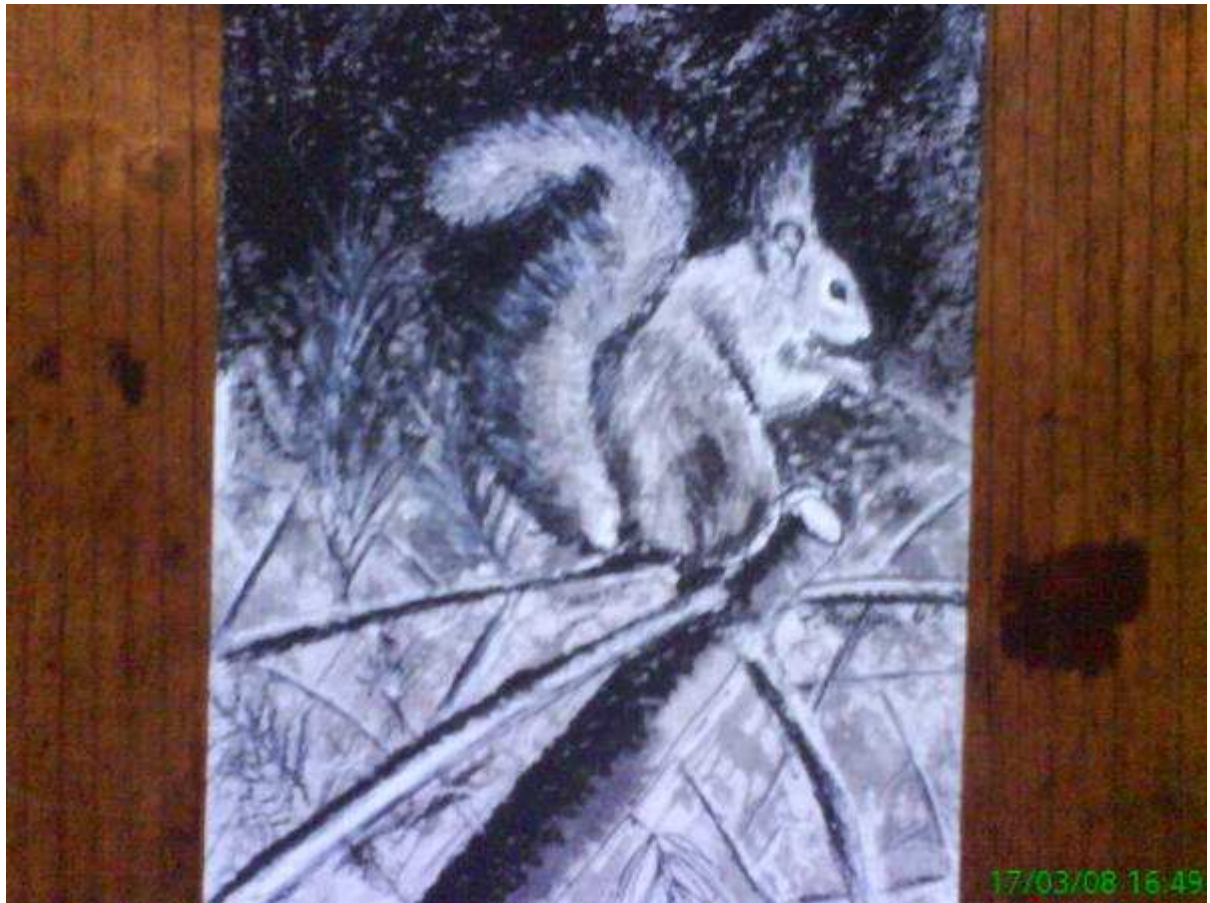
Petit écureuil grignote tranquille et serein, au faite d'un pin sylvestre. (Scirius Vulgaris).