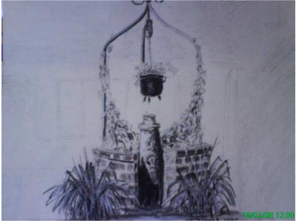
Superbe puit ornant la petite place du bourg de sennely.