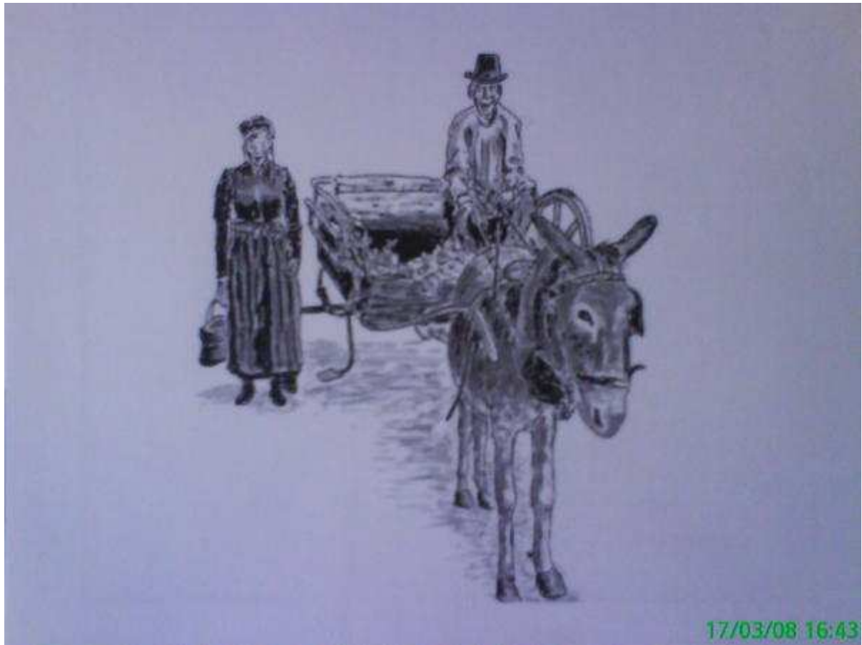
Monochrome d'un attelage du début du XXeme siècle. Cette voiture était tractée par un âne. (Equus Asinus).