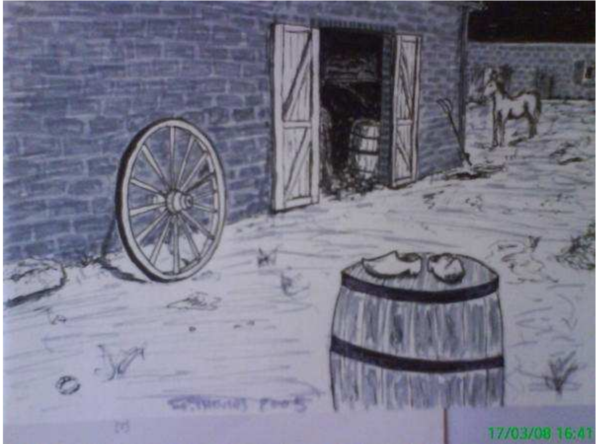
Ferme de Sologne du début du XXème siècle.