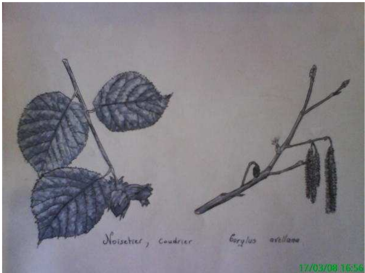
Monochrome d'échantillons botaniques de coudrier. (Noisetier). (Corylus Avellana).