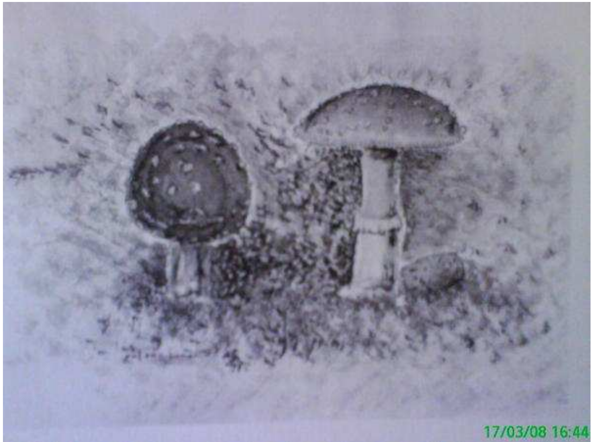
Monochrome d'amanite tue mouches. (Amanita Muscaria).