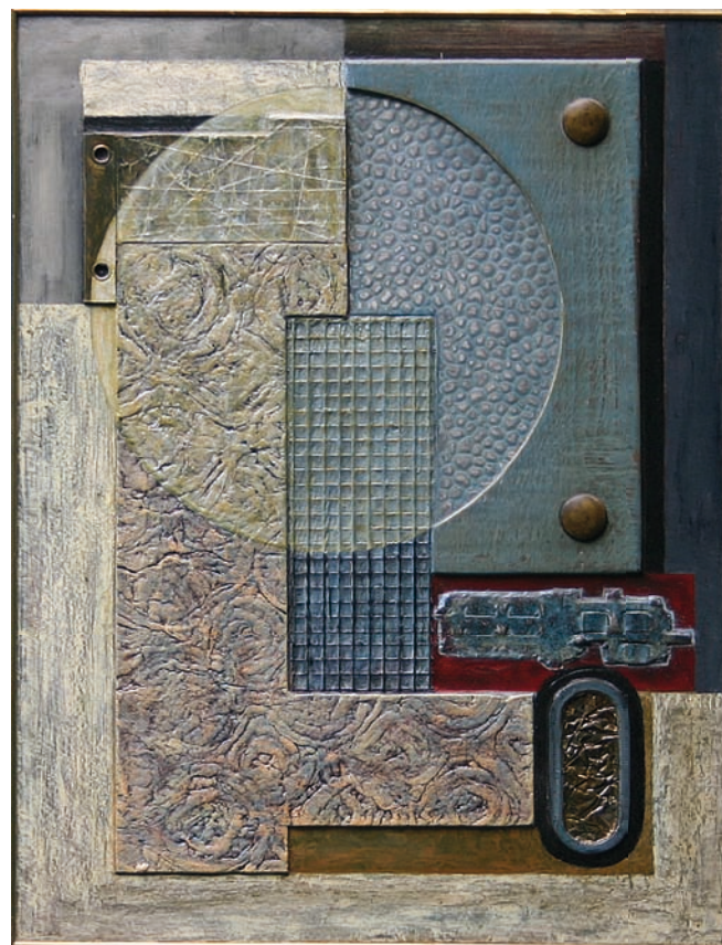
Relief en fer, bois, laiton et carton Dim : 40 x 30 cm - Année : 1987