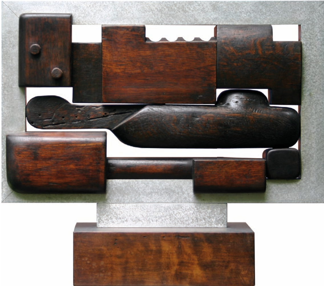
Sculpture en bois et métal « Claustration » Dim : 40,5 x 35 x 14,5 cm – Année : 1980

«Les sculptures de Serge BENOIT laissent apparaître à la fois l'influence de Hans Arp et celle de l'esthétique néo-cubiste, encore que des réalisations plus récentes se sont libérées de ces attaches et, dans un esprit plus baroque, assemblent des éléments et des matériaux hétérogènes.»