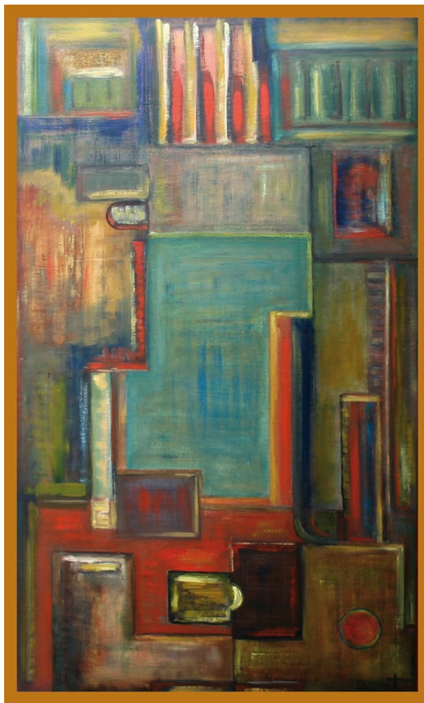
Peinture mixte sur panneau marouflé Dim : 104 x 63 cm - Année : 1988

L'œuvre de Serge Benoit, révèle un artiste épris de rigueur originale, une manière de formaliser la matière qui lui est propre. Une impression dans l'espace de ce qu'on appelle l'Art Zen : sculpture Zen, comme autant de calligraphies tracées au burin.