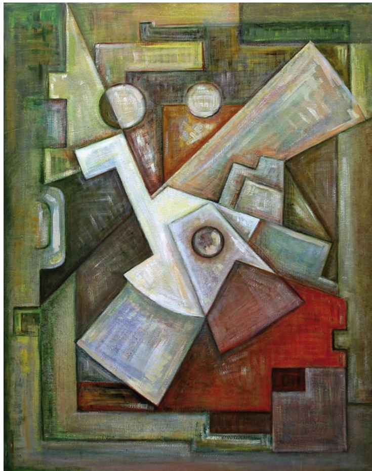
Peinture à l'huile sur toile Dim : 93 x 74 cm - Année : 1982

S erge Benoit aborde la sculpture en autodidacte à partir de 1961. A la recherche d'un langage personnel, il aborde d'abord la figuration et les matériaux traditionnels comme la pierre, le bois, le marbre ou le granit en se mesurant à eux par la taille directe. Travaillant ensuite chez des artisans menuisiers ou serruriers, il se tourne vers le métal et utilise des chutes de récupération en fer ou en laiton pour faire ses sculptures figuratives d'abord, puis plus structurées.