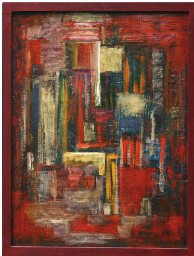
Peinture à l'huile sur panneau de bois Dim : 49 x 41 cm - Année : 1996