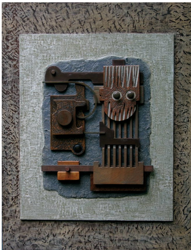
Relief en bois patiné avec ajout de fer et de laiton Dim : 65 x 50 cm - Année : 1986