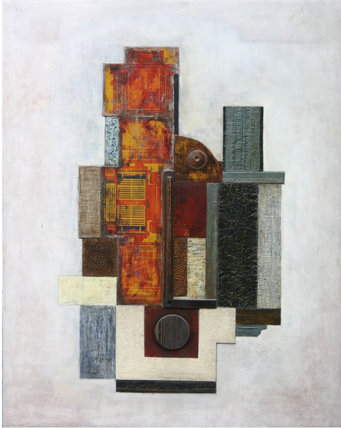
Relief en fer, zinc, laiton et bois sur panneau peint Dim : 76 x 60 cm - Année : 1989

Il traite le bois avec beaucoup de talent. Les signes, les marques faites au burin ou au ciseau à bois sont là pour « donner du grain, dit Benoit, de la force ». Noircis avec un glacis de goudron ou colorés avec une peinture très liquide, les creux et les bosses deviennent plus présents, le bois, plus vivant. En parlant avec lui gouges, tire-fond, tiges filetées, on s'enrichit d'un vocabulaire qui nous fait mieux apprécier l'originalité de son travail.»