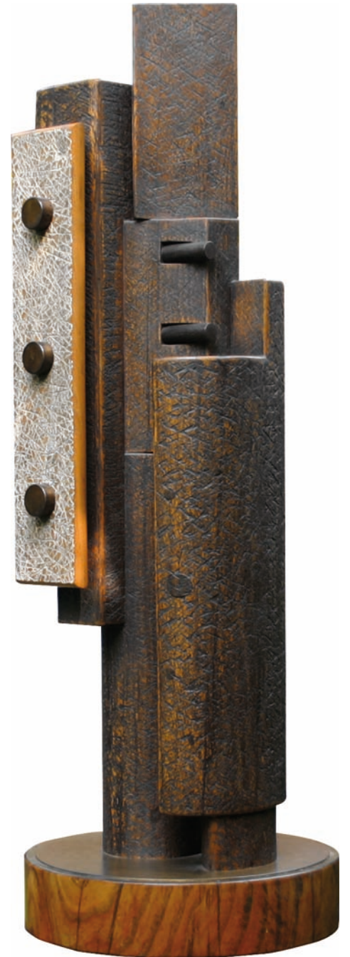
Sculpture en chêne, bronze et fer Dim : 109 x 36 x 36 cm - Année : 1991

«Serge Benoit se plaît aussi aux assemblages savants de tôle oxydée, de laiton martelé, de bronze patiné avec des bois africains, du palissandre ou du chêne. Quant il s'agit de petites pièces, il compose et recompose ses créations comme des puzzles.»