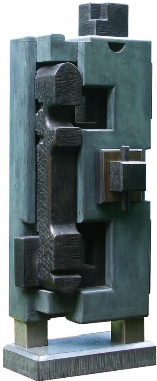
Sculpture en Bois Patiné et Métal Dim : 72 x 31 x 27 cm - Année : 1986