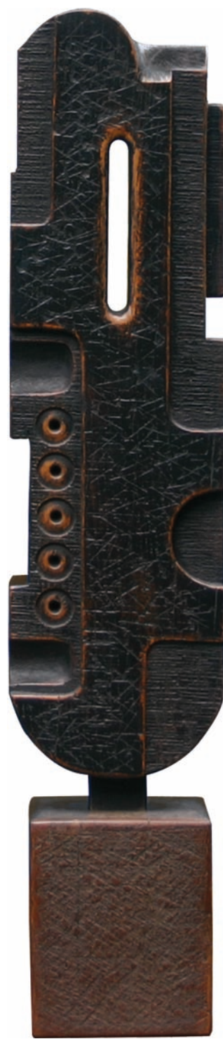
Sculpture en Chêne Dim : 68 x 15 x 12 cm - Année : 1980

Ecrasé par ces forces, l'artiste cherche aussi à en percevoir les mécanismes et par là à les domestiquer. Interrogation plastique sur les rapports entre l'homme et la machine, et entre l'homme et la société moderne, les sculptures de Serge Benoit sont l'expression originale d'un artisan et d'un ouvrier devenu sculpteur.