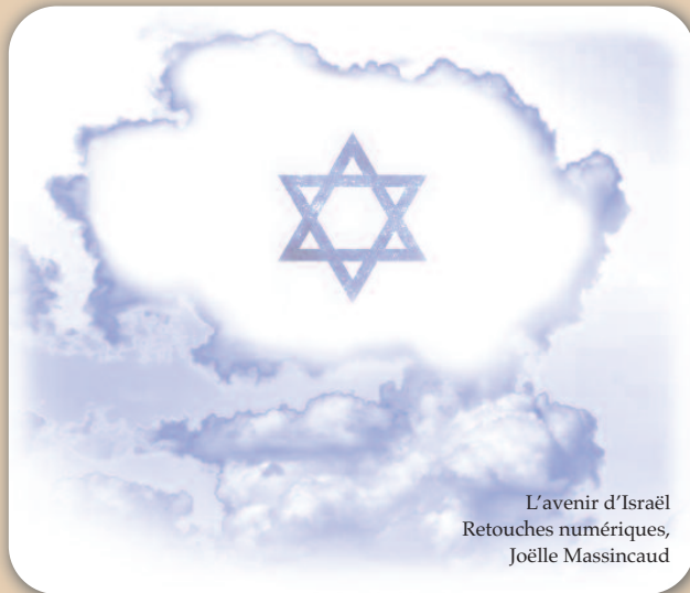
L'avenir d'Israël Retouches numériques, Joëlle Massincaud

Le prophète Zacharie explique que lorsque le Seigneur (le Dieu-Homme) reviendra pour secourir Israël, Il posera ses pieds sur le Mont des Oliviers (Zacharie 14.4). Il viendra avec puissance et une grande gloire (Matthieu 24.30), une flamme de feu dans ses yeux et le jugement dans sa bouche (Apocalypse 19.11-12).