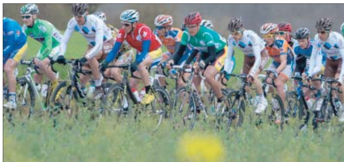
L'Estonien Joeaar, ici avec la maillot vert sur la Boucle, devrait encore être très entouré ce week-end.