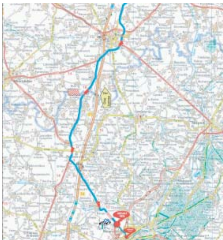
Deux jours de course désormais, mais toujours un départ depuis Margny-lès-Compiègne, samedi à la mi-journée.