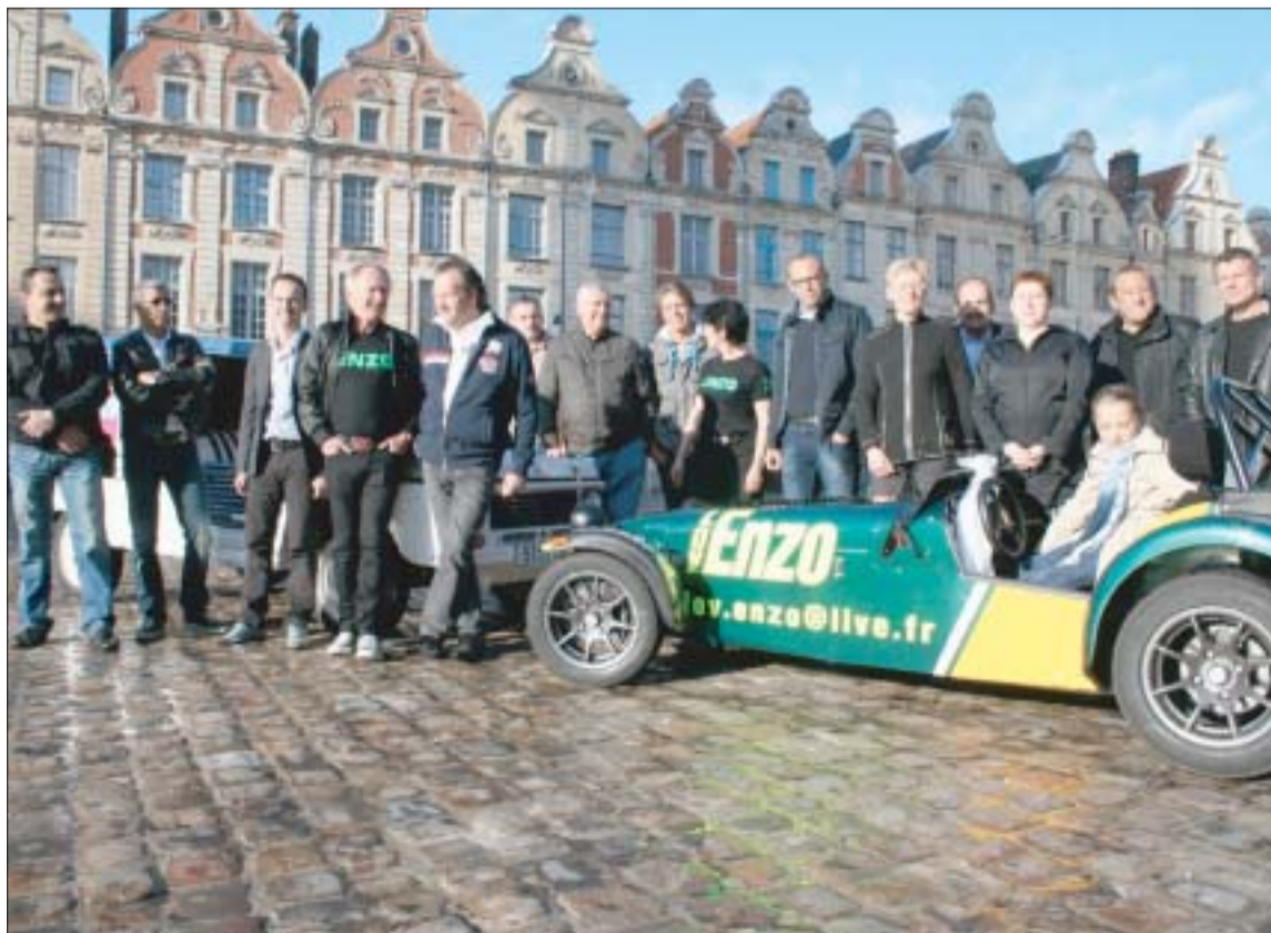
Une trentaine de partenaires participeront avec des véhicules à la caravane de ce Paris-Arras Tour.

Pour soigner l'extra-sportif, cette trente et unième édition de Paris-Arras sera à la fois gourmande, musicale et muclée. Gourmande, avec le gâteau spécialement conçu pour l'occasion ( lire page 3 ) ; musicale avec les dix-sept accordéonistes et le bandonnéoniste qui égayeront le village-départ à Margny-lès-Compiègne ; musclée avec les jouteurs d'Arras (venus en musique également) qui sortiront les géants de l'hôtel de ville pour les présenter au peloton. Il se murmure même qu'un challenge des Géants pourrait voir le jour sur le Paris-Arras 2013, avec les communes qui en possèdent pour emblèmes. ■ V. L. G.