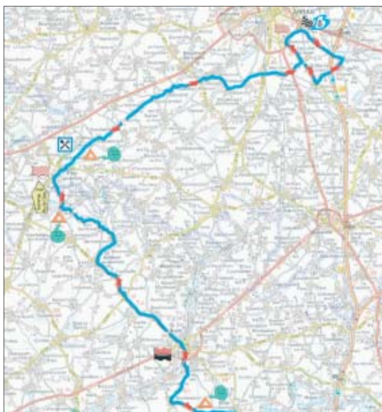
Le peloton entrera ensuite dans le Pas-de-Calais par Pas-en-Artois, avant de filer vers Beaurains, où l'attendra le circuit final.