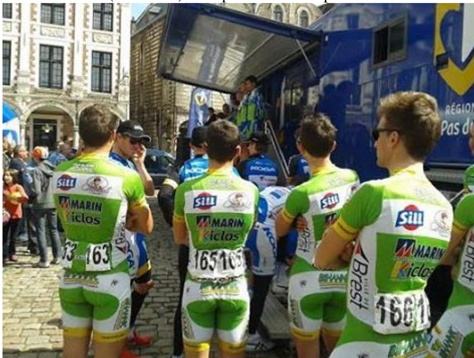
Le BIC 2000 avant la signature