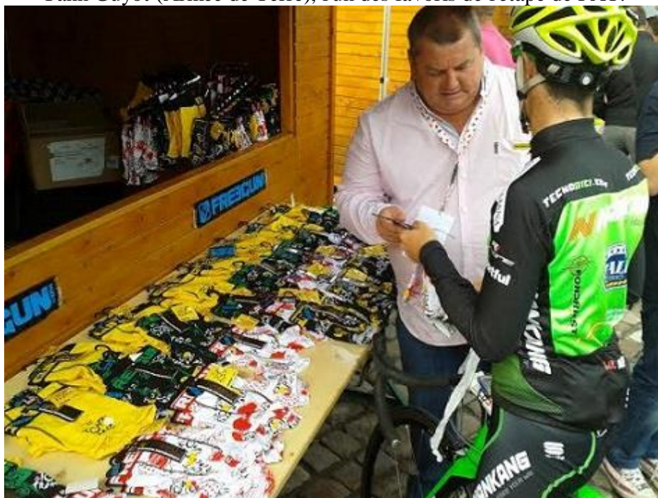
Du côté de chez Nankang, on va repartir avec un souvenir...