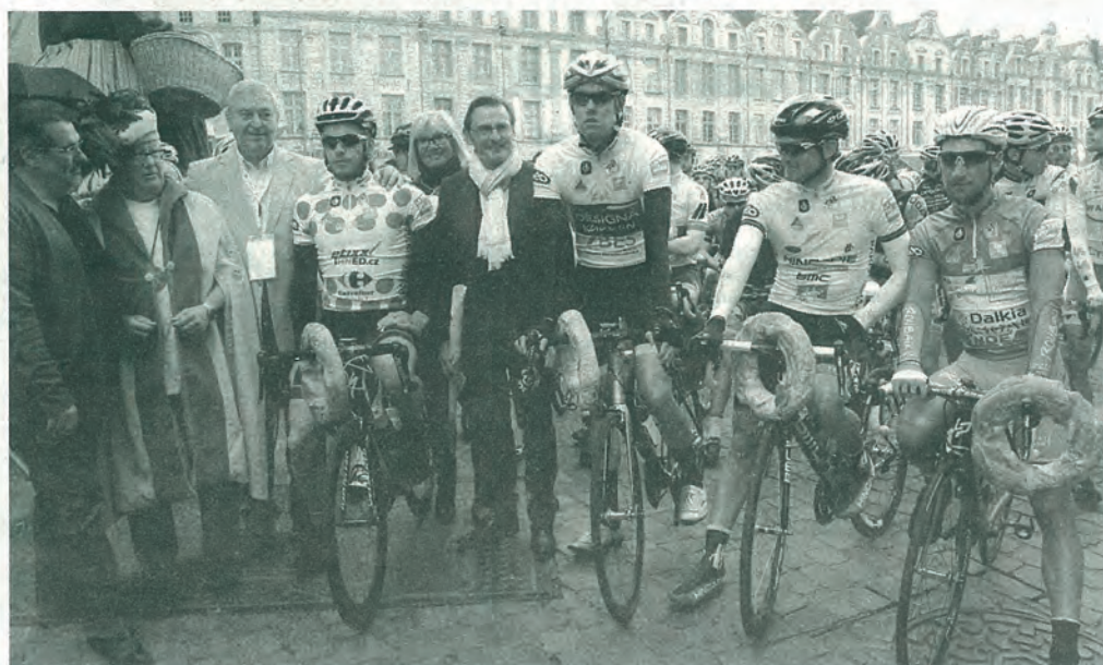
Les leaders au départ de l'étape du dimanche.