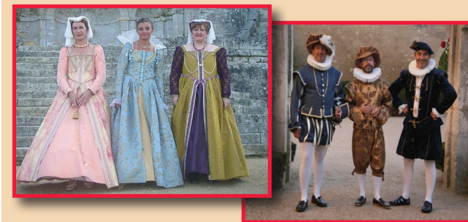
Collectif d'acteurs participants à des mises en scène historiques.