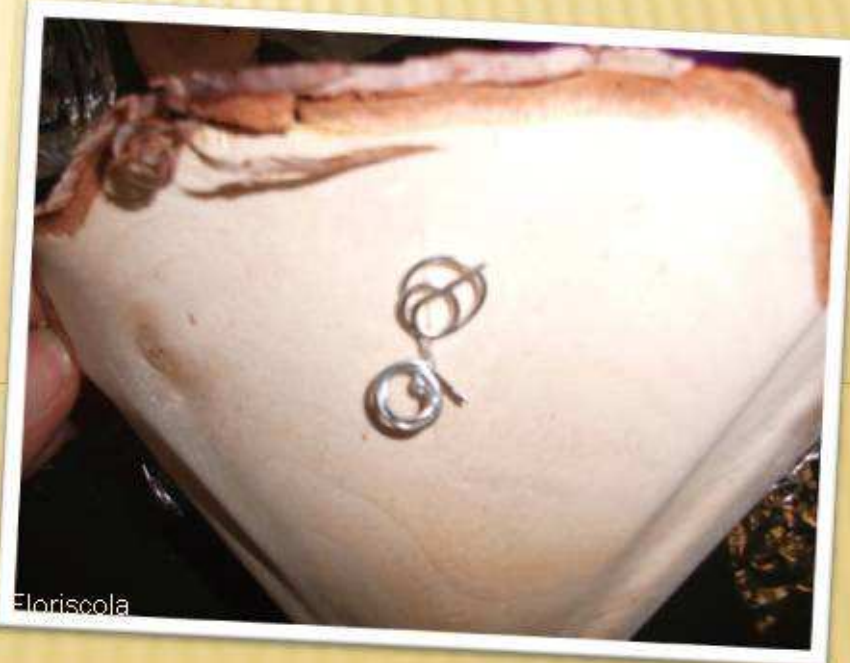
Photos et montage réalisés par Kerine (Lu) pour l'Association Floriscola. Cours 14h du 06/3/2012