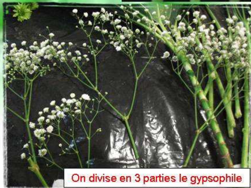
On divise en 3 parties le gypsophile

Photos et montage réalisés par Karine (Lily) pour l'Association Florivocla Cours 14h du 07/02/2012 - Amourette