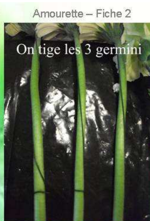
Amourette – Fiche 2