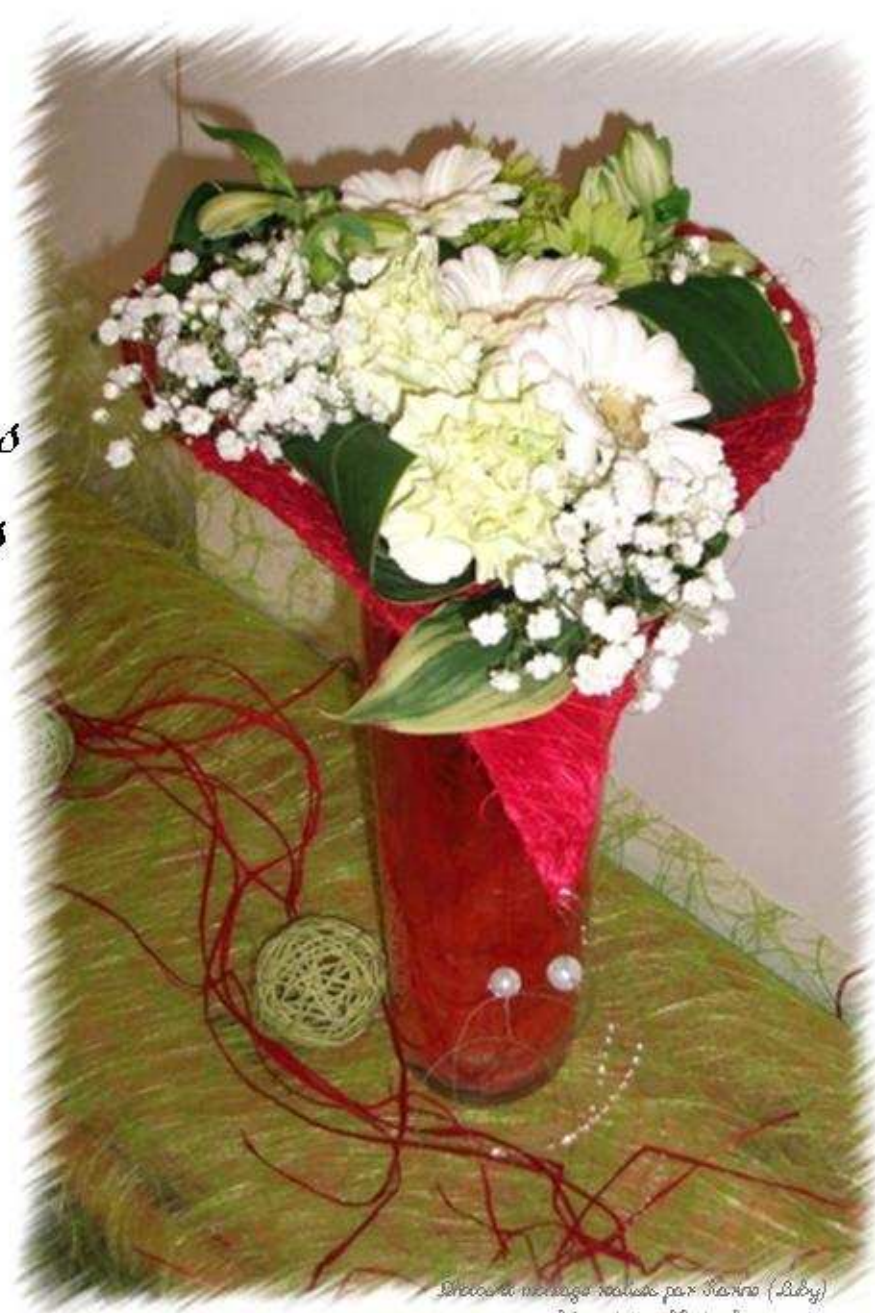
Cours 14h du 07/02/2012 - Amourette

Agrafeuse, ciseaux, couteau, pince coupante