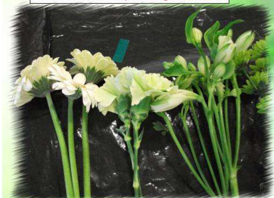
On nettoie, on coupe, on tige les fleurs