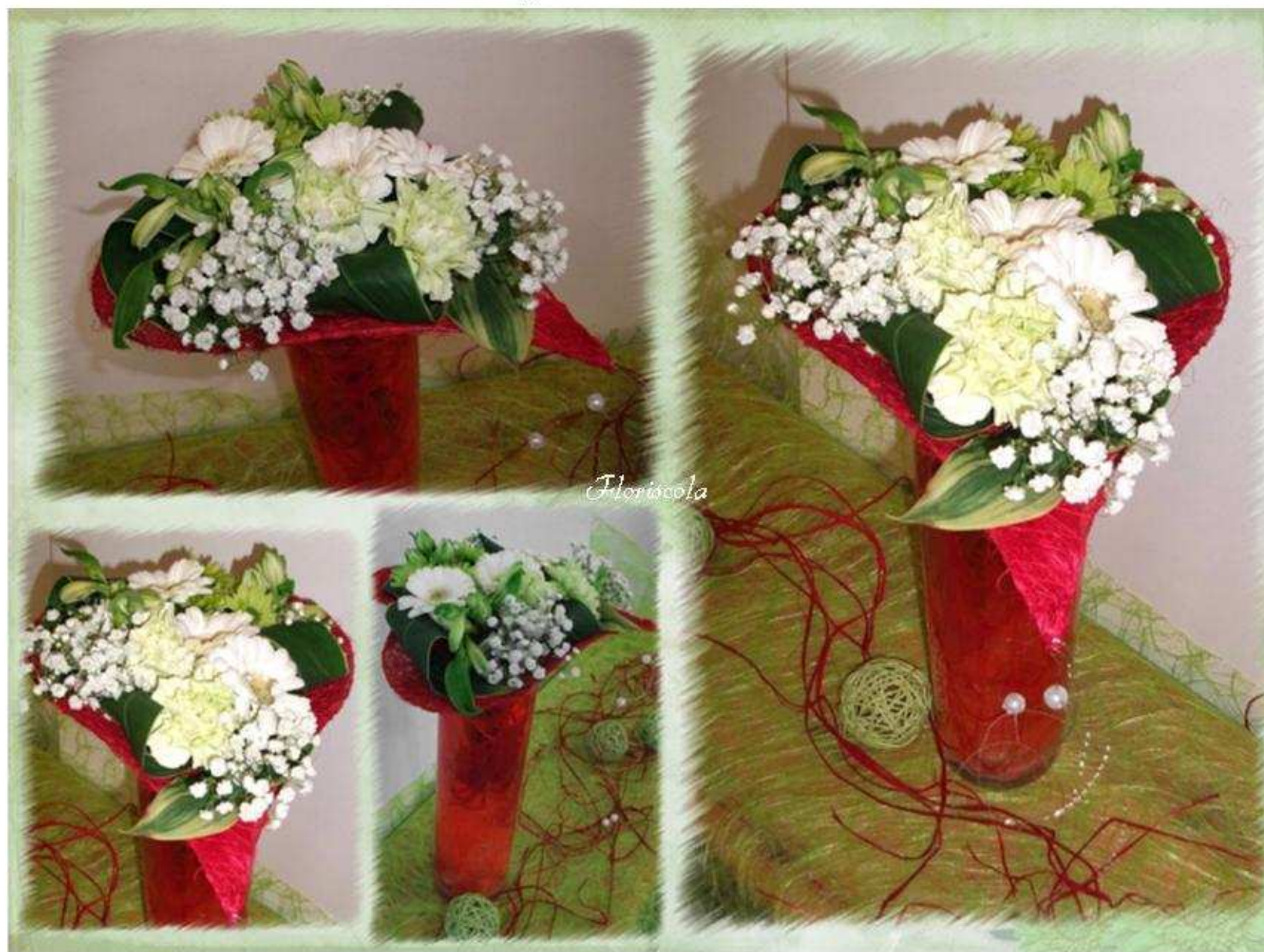
Photo et montage réalisés par Stéphanie (A.B.) pour l'Association Floriscola. Cours 14h du 07/02/2012 - Amourette