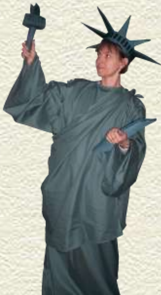
Statue de la liberté OMSPA Clichy