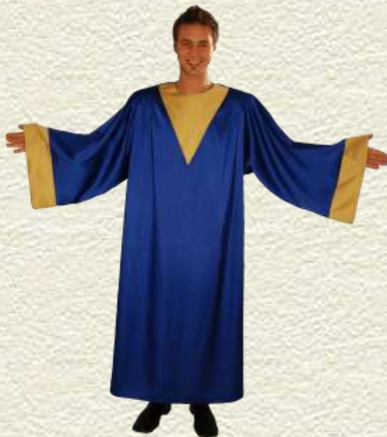
Robes Gospel pour un séminaire d'entreprise