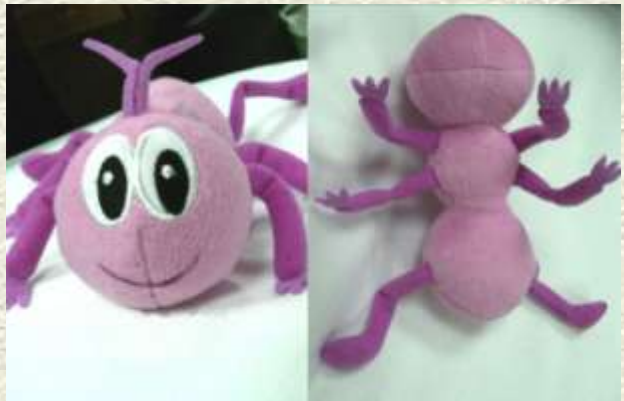
Mascotte de fourmi Objet promotionnel