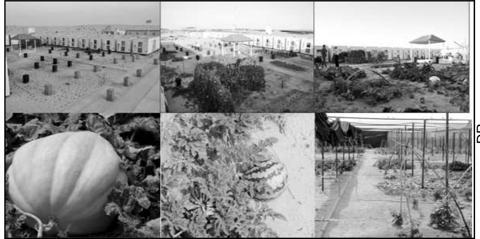
La lutte contre la désertification par la plantation d'arbres et les cultures en plein désert

vivriers de ces milliers de travailleurs, se fait à partir de Diffa et de ses contrées voisines. Il en est de même pour l'approvisionnement en viande, qui se fait chez les éleveurs et autres populations vivant à Agadem. Pour montrer l'impact économique de cette présence de la CNPC à Agadem, le mouton qui se vendait au début du projet à 10 000 FCFA est aujourd'hui acheté à 40 000 FCFA par la société chinoise, et ses sous-traitants, et cela pour permettre à la population locale de profiter de ses revenus et de renouveler son cheptel. En outre il est prévu que 15% des recettes pétrolières seront destinés au budget des communes de la région concernée pour le financement du développement local. Pour désenclaver la zone d'Agadem, la CNPC a construit un aéroport dont la piste a une dimension de 2200mx40m. Le coût de cette grande réalisation est chiffré à plusieurs centaines de millions de nos francs. C'est