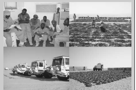
Les travaux géophysiques

Environ 5400 employés en deux années d'activité avec un taux de nigérisation de 78 pourcent. 15 pourcent des recettes pétrolières seront versées pour le budget des communes de la région concernée pour le financement du développement local.