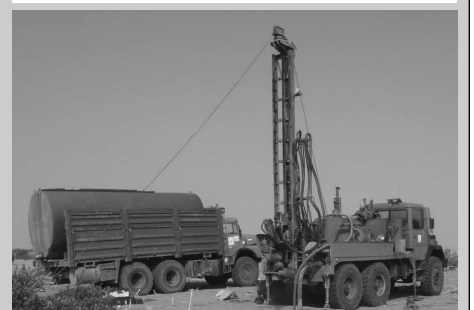
Une centaine de points d'eau ont été réalisés