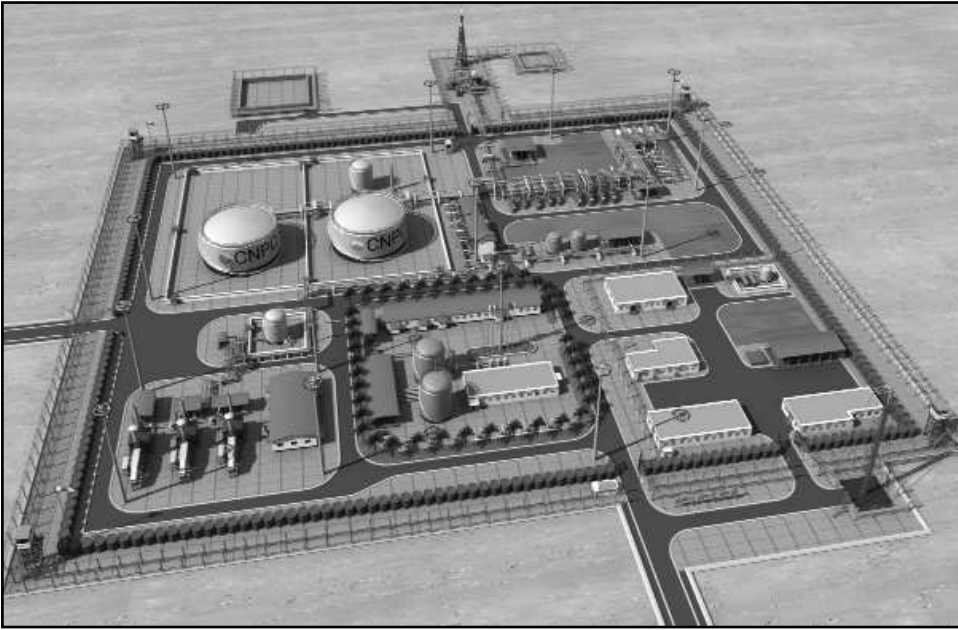
La construction de la CPF progresse de manière surprenante

L'avenir se profile sous de meilleurs auspices pour le Niger. En effet avec la signature du contrat avec la CNPC, de nombreux travaux sont actuellement en cours d'exécution dans le nord-est du pays, et particulièrement sur le site pétrolier d'Agadem. Le contrat prévoit la construction d'une raffinerie ; travaux actuellement en cours à Zinder ; et d'un oléoduc d'une longueur de près de 2000 km pour rallier Cotonou, au Bénin. La société chinoise va produire 20 000 barils de pétrole par jour, pour une consommation du Niger qui est de l'ordre de 7 000 barils par jour. Au plan social, la société chinoise multiplie également ses réalisations qui visent le bien-être des populations de la zone.