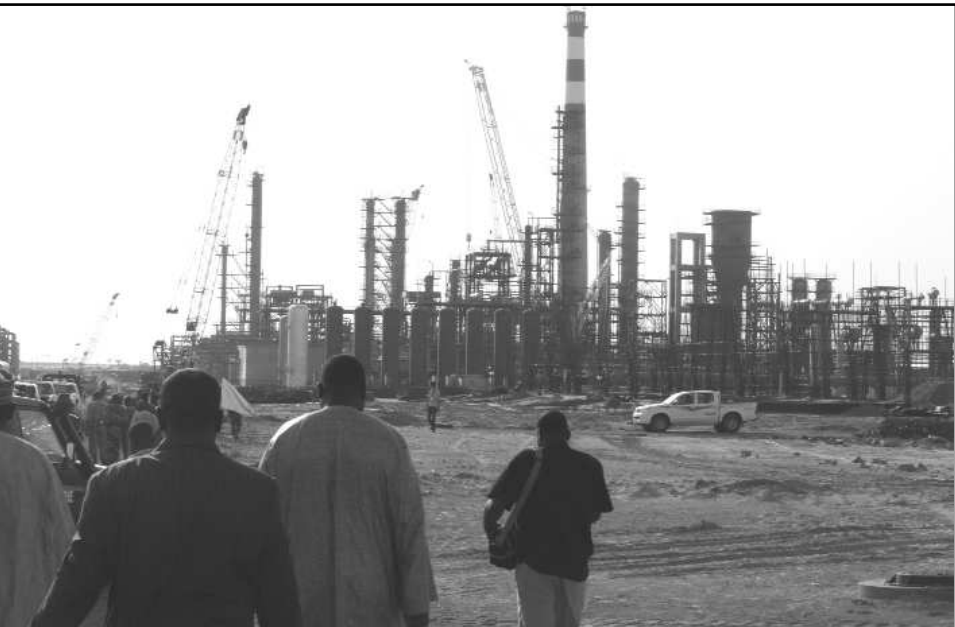
Des grands travaux pour un avenir radieux des populations