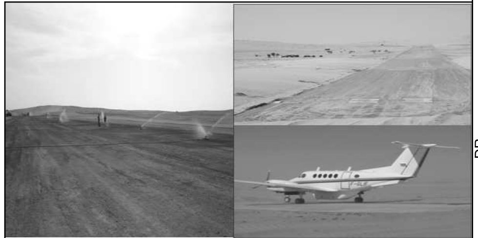
Un Aéroport (2200mx40m) se chiffrant à plusieurs centaines de millions de nos francs a été réalisé dans ce désert pour désenclaver la zone avec 5 à 6 vols par semaine