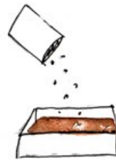
semer et observer les fleurs