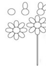
dessiner des fleurs