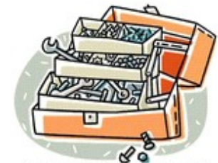
BOITE A OUTILS