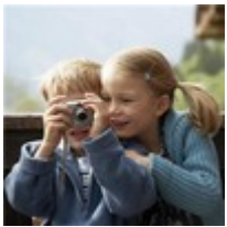
faire des photos

Parmi les 6 activités que tu as faites à l'école, choisis les 3 activités que tu préfères