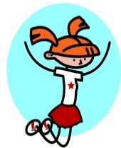
faire de l'EPS