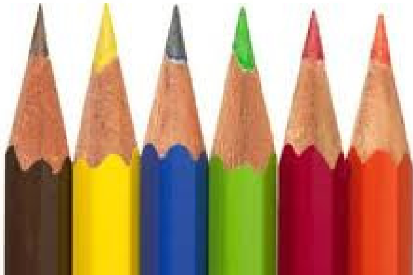
CRAYONS DE COULEUR