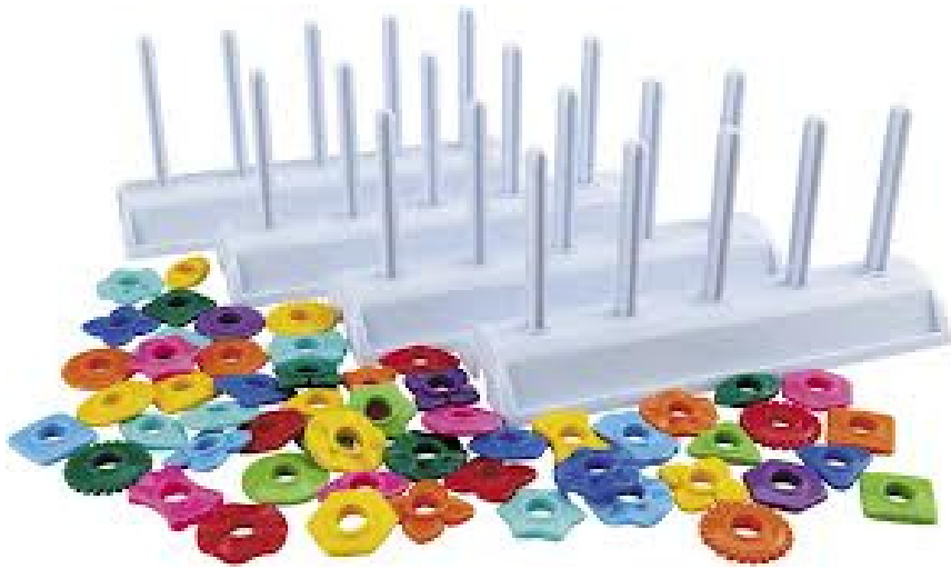
PERLES ET ABAQUES