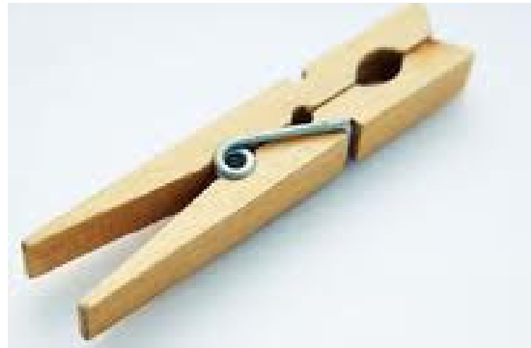
PINCE A LINGE