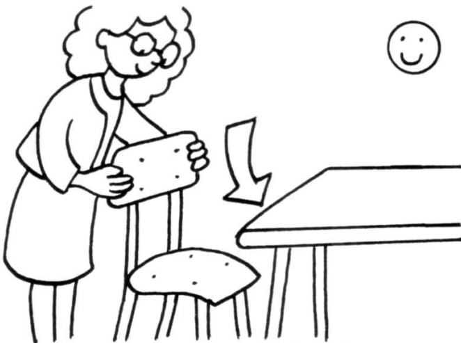
ranger sa chaise