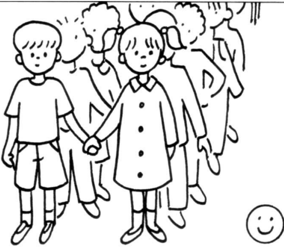
se mettre en rang