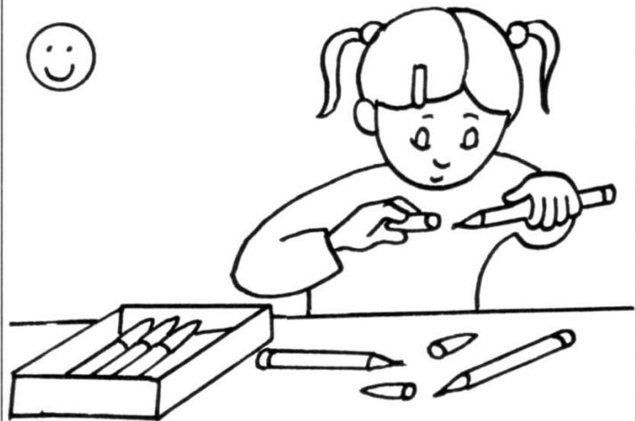
ranger le matériel