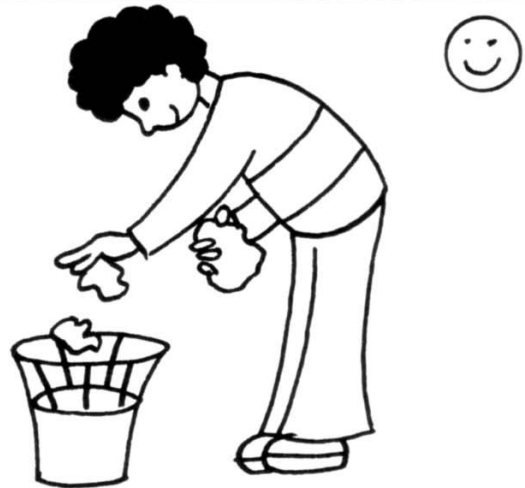
jeter les papiers à la corbeille